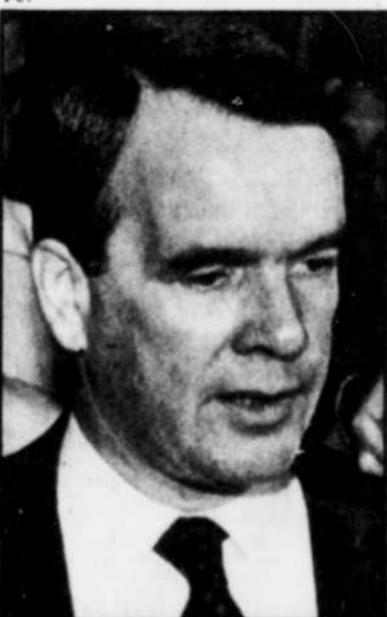
Le sénateur Lowell Murray

Le député libéral André Ouellet, membre du comité mixte, a dit douter qu'une telle réforme puisse être réalisée, parce qu'il sera nécessaire de recueillir un consentement unanime des provinces en vertu d'une provision de l'Accord constitutionnel de 1987.