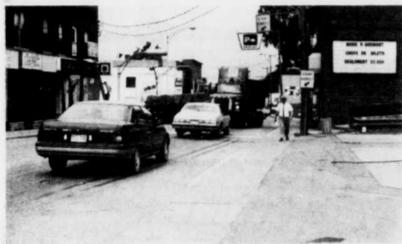
La circulation est toujours aussi hasardeuse à l'angle des rues St-Georges et Principale nord.

Le dossier demeure actuellement entre deux mains.