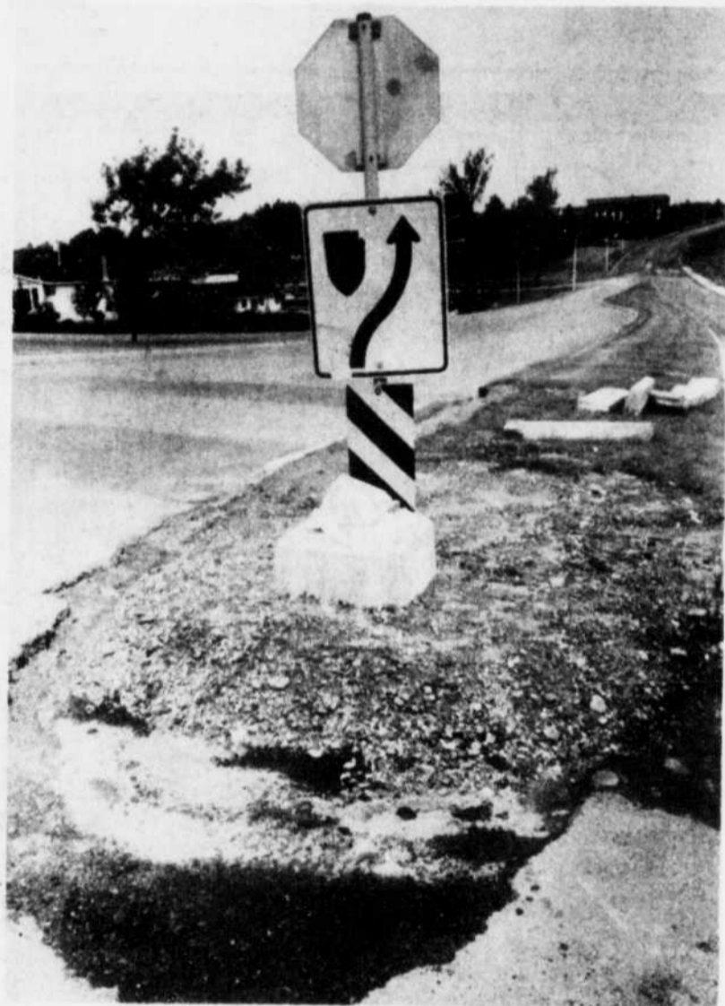
La pose de cette base de béton, à la hauteur des boulevards Portland et Lionel-Groulx, a nécessité de briser des aménagements fraîchement complétés.