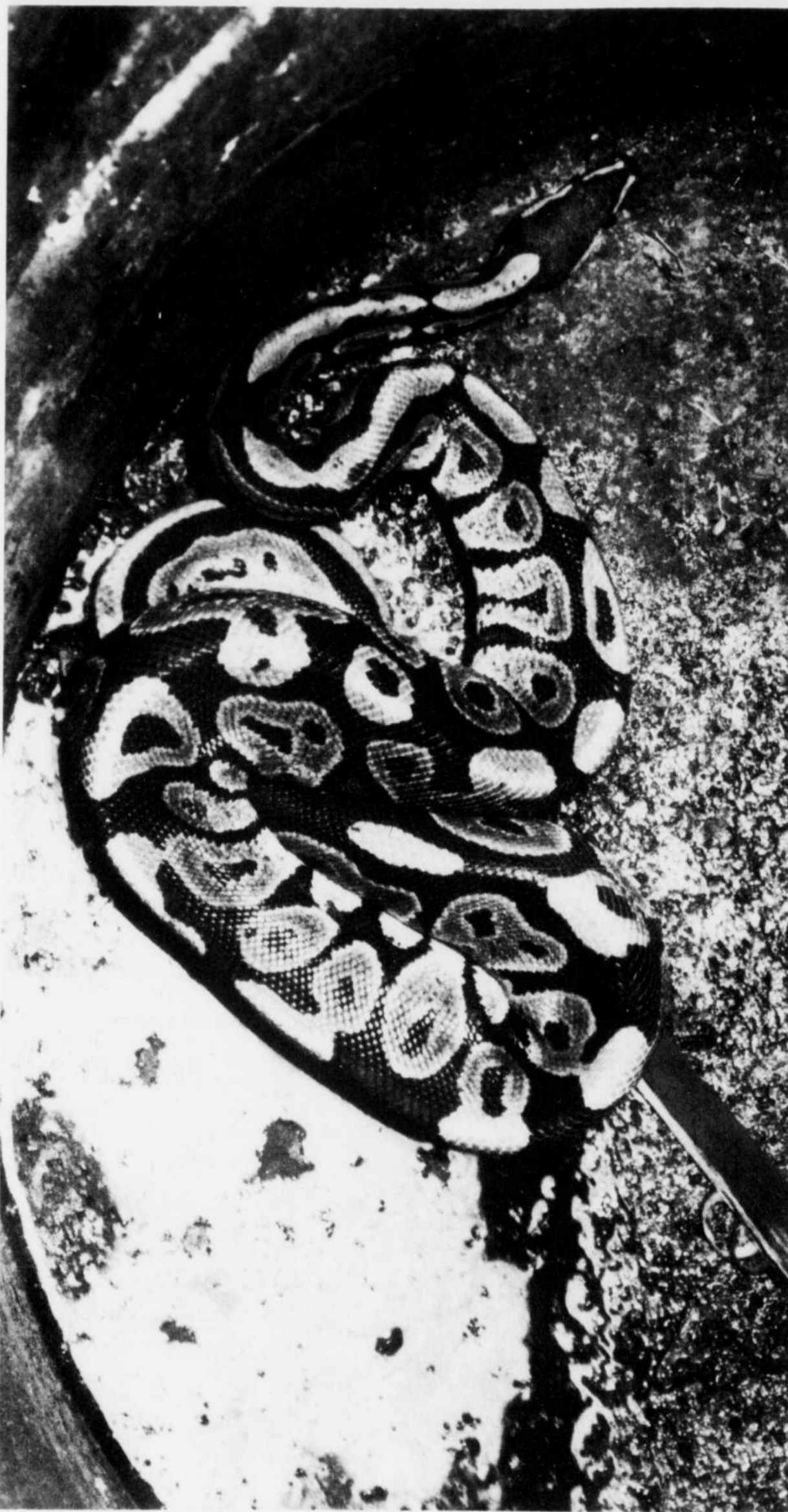
Le python égaré s'était logé dans un baril à déchets.

Mme Côté ne vend pas de reptiles ou insectes venimeux, car, dit-elle, "il n'y a pas de plaisir à les caresser".