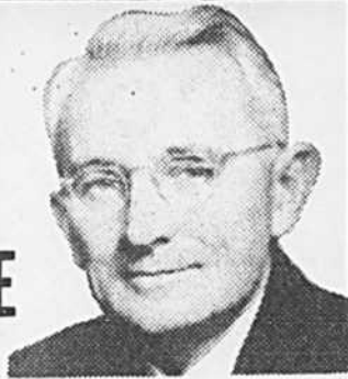
DALE CARNEGIE auteur du livre "Comment se faire des amis"