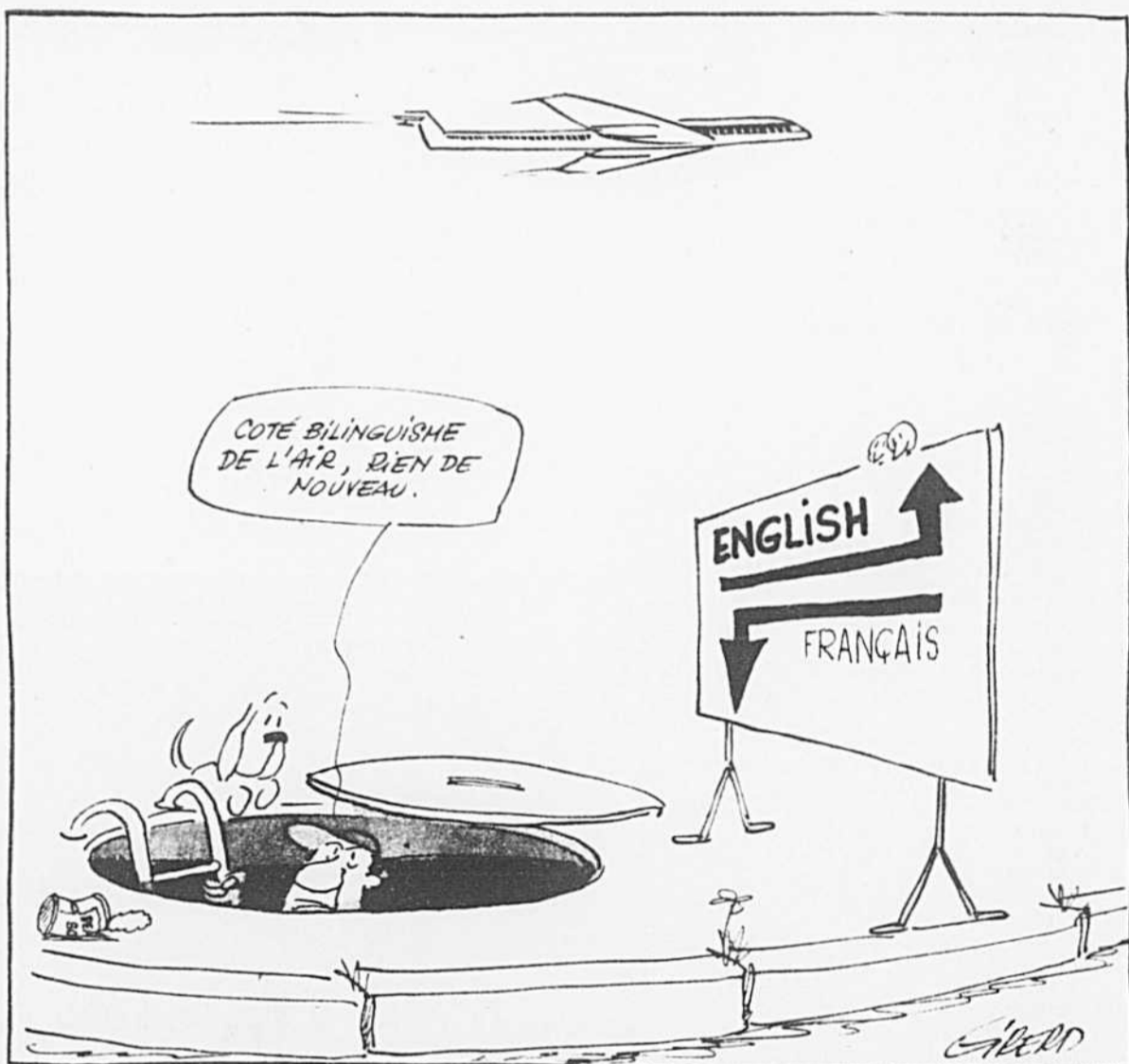
Gibert est en vacances cette semaine. Les caricatures étaient des réprints.