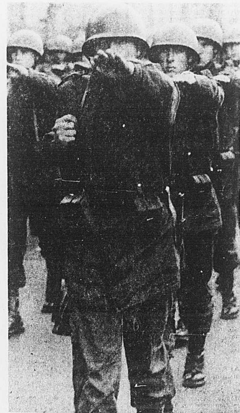
Le coup d'Etat du 24 mars en Argentine a doté l'Amérique latine d'une autre dictature militaire.

Comme presque partout où les forces politiques démocratiques sont muselées ou tout simplement interdites, l'Eglise brésilienne a dénoncé le régime et les odieuses violations des droits de l'homme grâce auxquelles il se maintient. La même condamnation — de la part de l'Eglise,