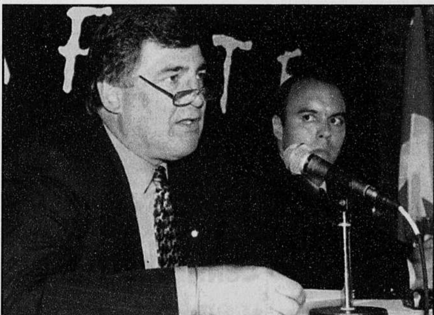
Serge Savard: «Si un chasseur de têtes vient me parler, il risque de rester dans le corridor ou dans la salle d'attente.»

de hockey Canadien. Si on veut me parler, on peut me parler.