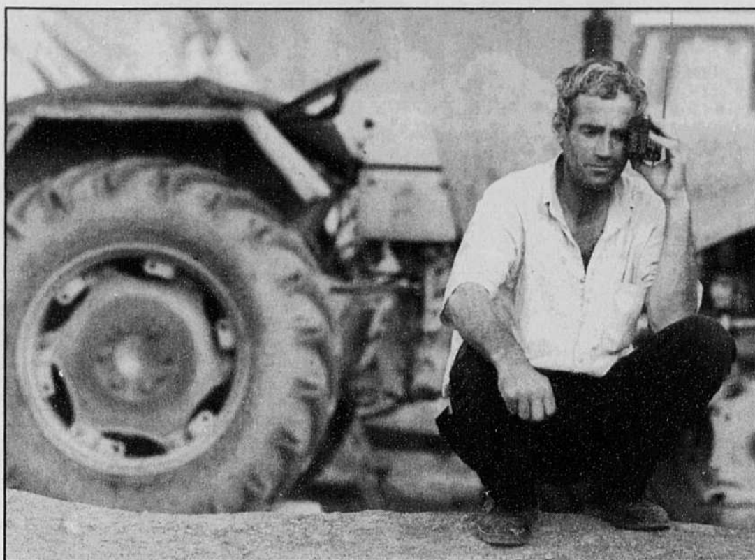
Un réfugié du camp de Kukes, en Albanie, écoute les dernières nouvelles dans une petite radio. La nouvelle hier de l'approbation par Belgrade du plan de paix du G8 pour le Kosovo a laissé plutôt sceptiques les réfugiés de ce camp: en clair, ils attendent une confirmation sûre pour y croire.

Le plan russo-occidental est cependant rédigé