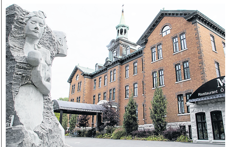
L'hôtel Montfort est un établissement sobre, mais pas dénué de cachet.