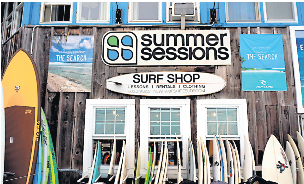
Si vous cherchez une planche de surf ou une planche à pagaie, vous les trouverez au Pioneers Board Shop, au Cinnamon Rainbow ou au Summer Sessions.

Les vacances sont terminées, mais cela ne veut pas dire qu'il est trop tard pour aller à la mer. Si Hampton Beach attire des milliers de familles l'été, dès que les marmots retournent sur les bancs d'école, c'est au tour des surfeurs de s'y précipiter. Avec des vagues plus fréquentes, le début de l'automne est le moment parfait pour surfer à la plage sur l'Atlantique la plus près de Montréal.