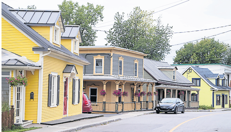
Les belles maisons de la rue Notre-Dame