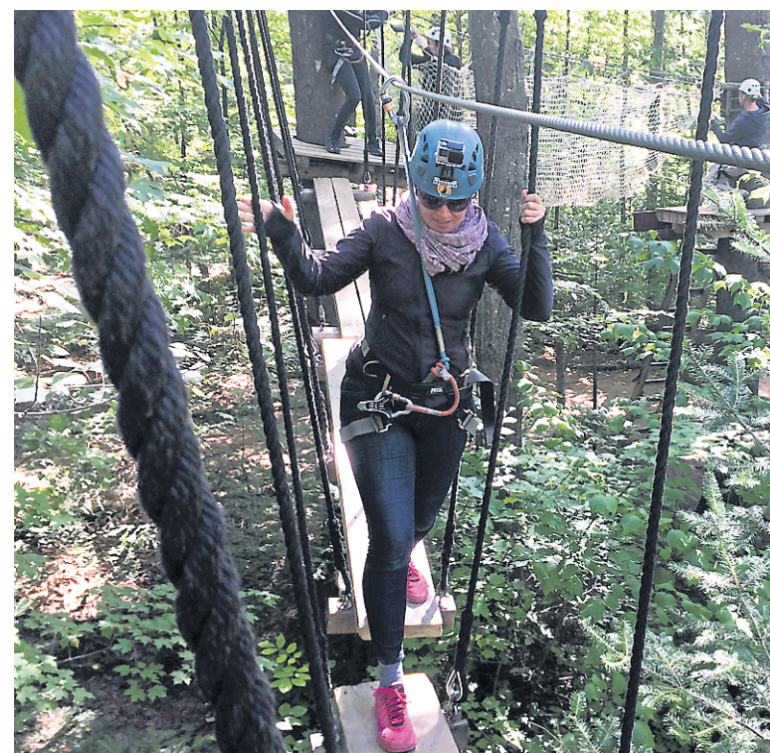
Il suffit de vaincre un tantinet ses appréhensions pour réussir les parcours d'Arbraska de Rawdon.

Y'a rien comme se retrouver sur une plateforme à une dizaine de mètres dans les airs, après