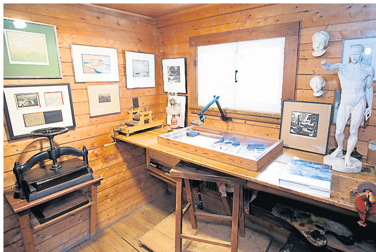
La Maison Rodolphe Duguay est une des plus jolies demeures de Nicolet.

centre-ville, la boutique Manu Factum, lieu sans égal de diffusion et de commercialisation de leurs œuvres. La marchandise est éclectique et les gravures côtoient les chaussons de cuir pour enfants et le linge de table tissé à la main. La qualité est variable, mais c'est l'une des rares boutiques qui mérite un détour à Nicolet.