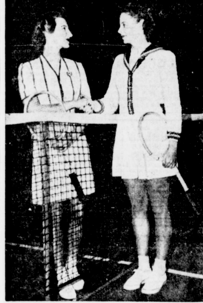
ALICE MARBLE, à droite, recevant de MARY HARDWICK les félicitations d'usage, après leur match d'ouverture de leur carrière professionnelle, au Garden de New-York. Alice gagnait 8-6, 8-6.