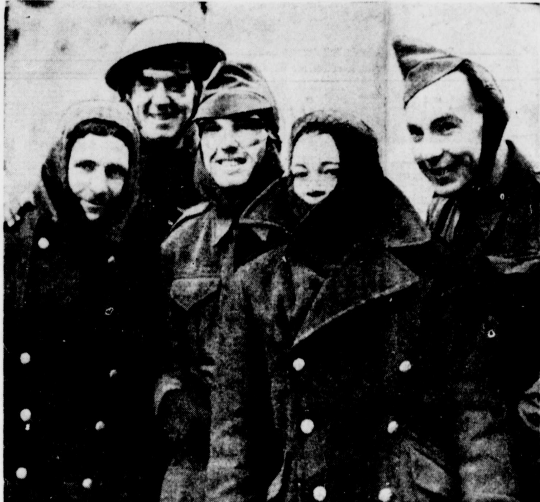
La température est froide à Londres et ces soldats semblent en ne peut plus satisfaits de leur nouvelle coiffure qui leur préserve les oreilles contre les intempéries de la saison. Ce sont des membres du Royal Engineers Corps, dont la tâche consiste à déblayer et à réouvrir les rues à la circulation à la suite des raids aériens. Quelques-uns portent un genre de visière spéciale faite d'un matériel transparent.