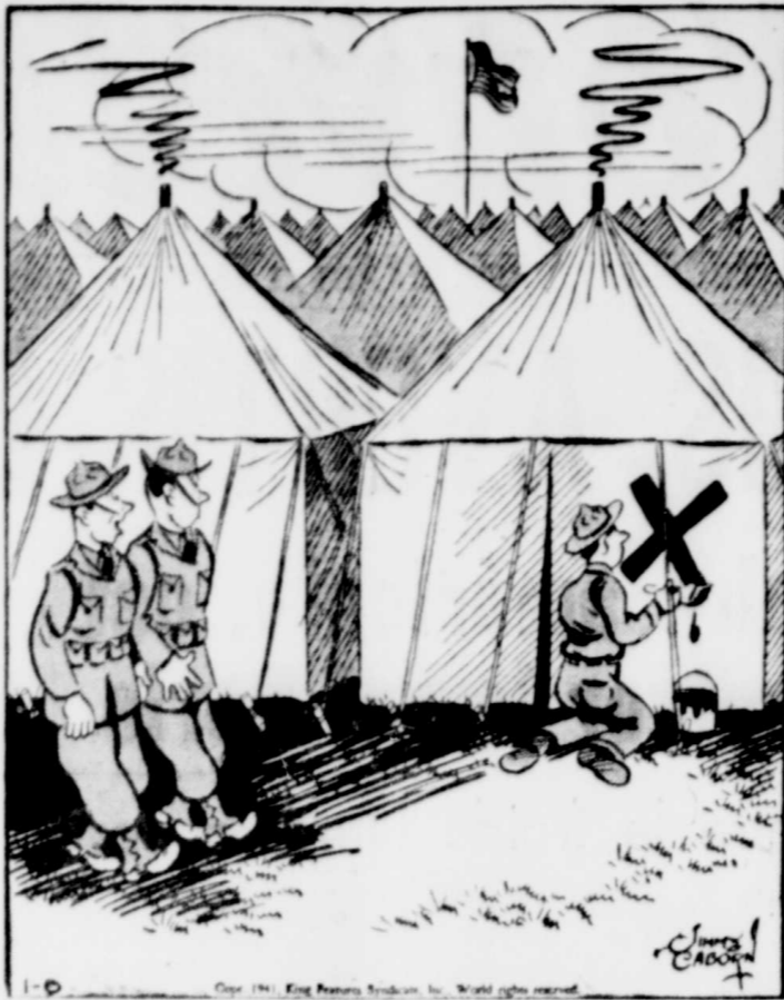
Pierre a de la difficulté à retrouver sa tente.

Un des plus grands bonheurs de cette vie c'est l'amitié, et l'un des plus grands bonheurs de l'amitié c'est d'avoir à qui confier un secret.