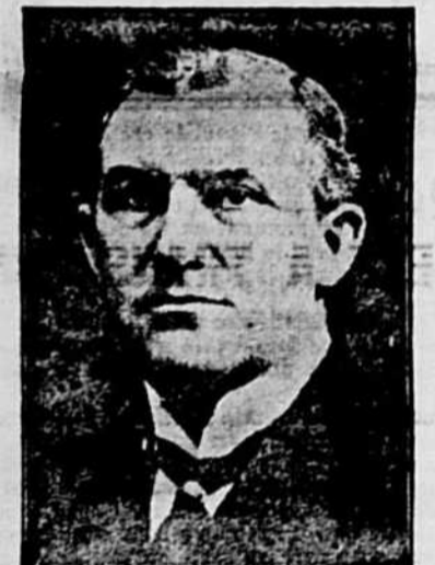
L'HON. M. MURPHY qui a fait une violente attaque contre M. Rowell.