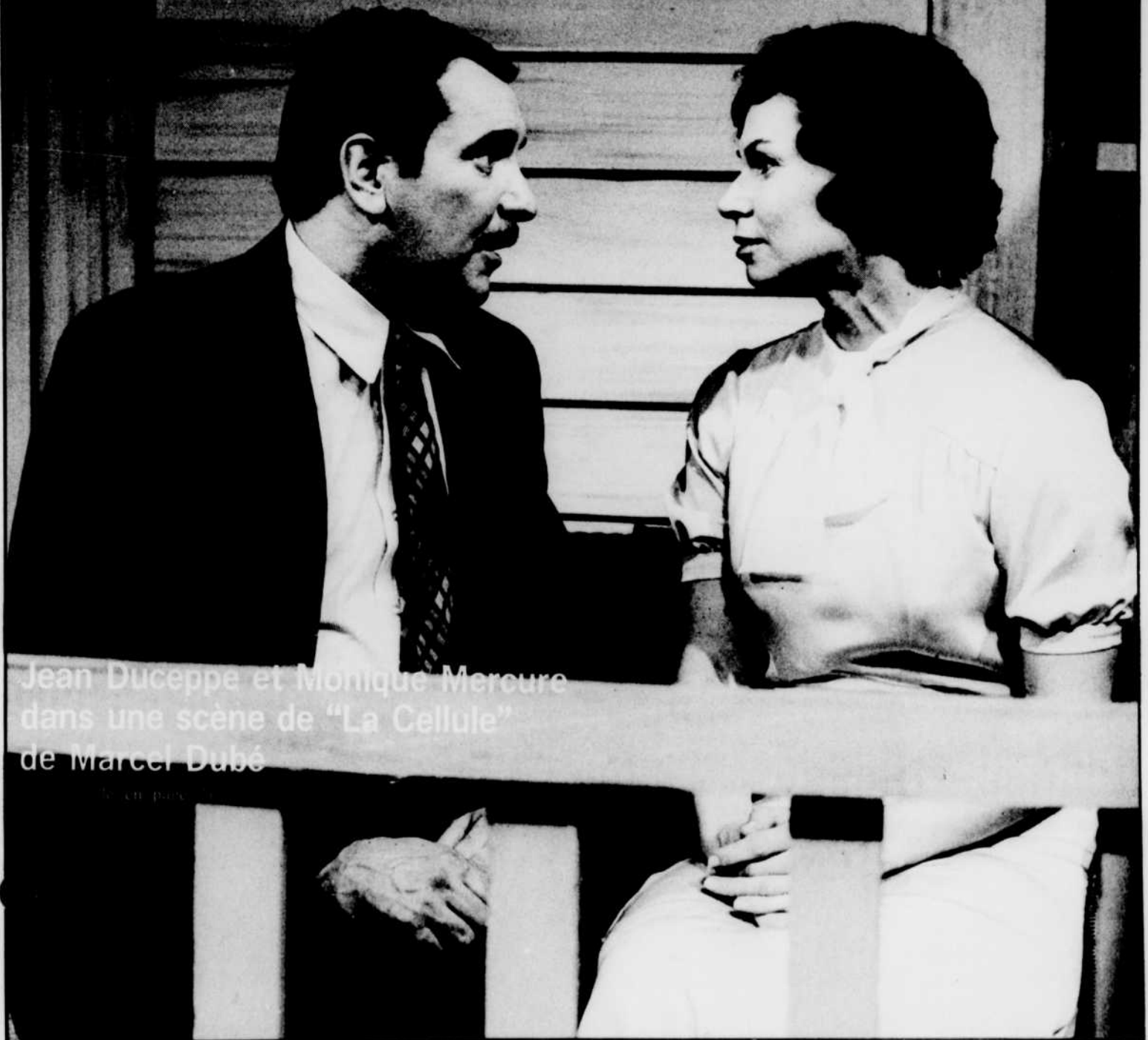
Jean Duceppe et Monique Mercure dans une scène de "La Cellule" de Marcel Dubé