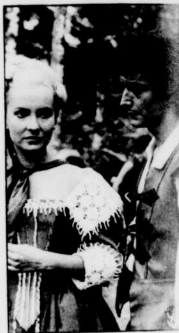
«Le Chevalier Tempête»