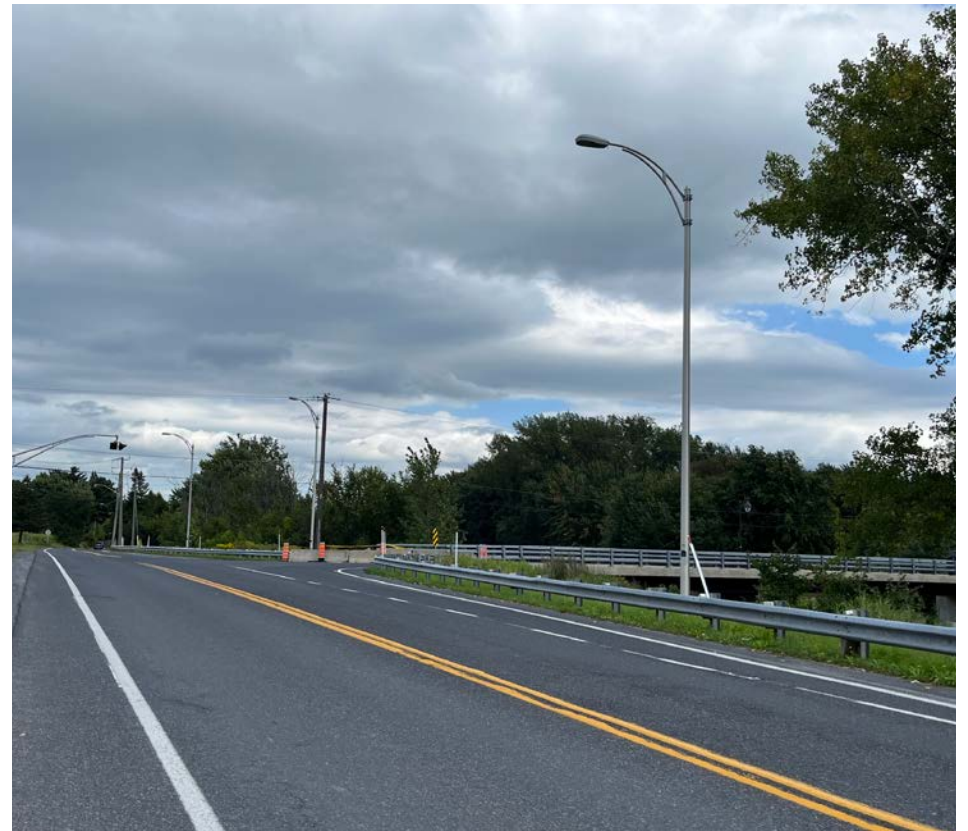
Trois ponceaux, sous la route 223, sont à reconstruire.

Trois ponceaux sous la route 223, à la limite de Saint-Basile-le-Grand et de Carignan, sont à reconstruire. Les travaux débuteront le 16 septembre et se poursuivront jusqu'à la fin du mois de novembre.