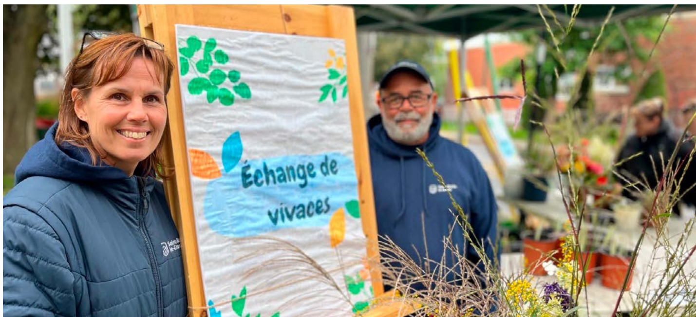
Quelque 2500 personnes ont foulé le site de la Fête de la famille au village.