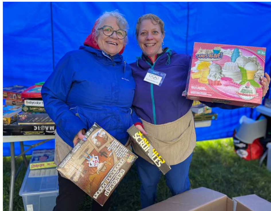
Le bazar annuel de la fabrique a permis à plusieurs familles de faire des trouvailles.