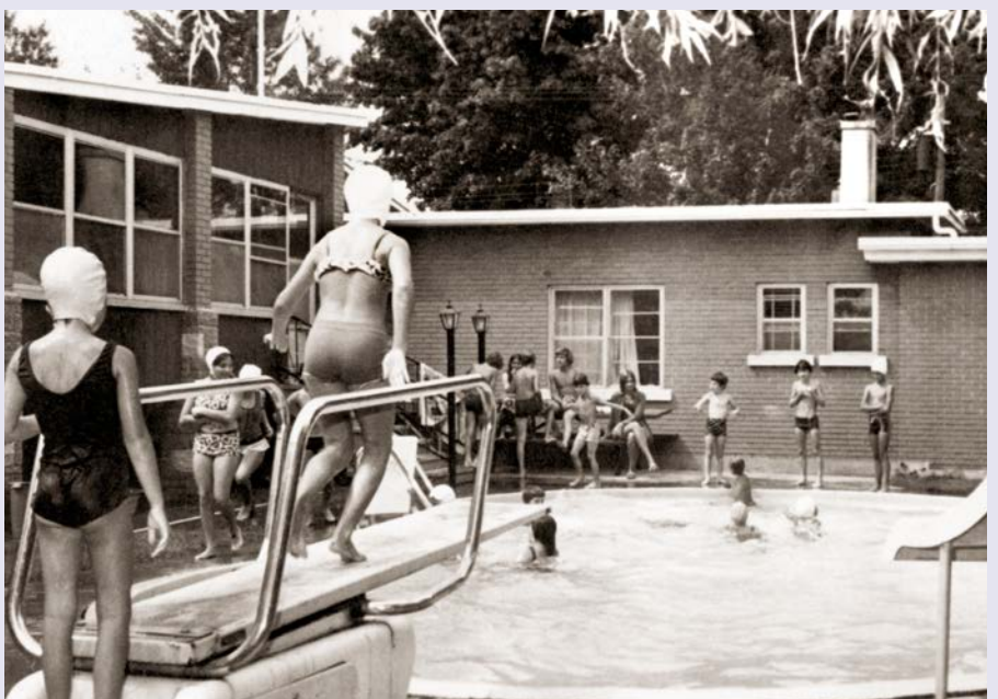
En 1973, les élèves des cours de natation à la piscine de la famille Boisvert.

cabinet de consultation dans un logement loué. En 1958, il acquiert un terrain et fait construire la maison toujours présente au 212-214, rue Principale. Le couple Boisvert aura sept enfants. Madame Boisvert est soucieuse de leur proposer des loisirs variés à proximité de la maison. Le couple fait aménager une piscine dans la cour arrière.