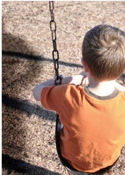
L'organisme La Clé sur la porte rencontre les jeunes dans les écoles pour les sensibiliser à la violence conjugale.