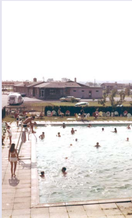
La piscine Maranda, près du boul. Sir-Wilfrid-Laurier.