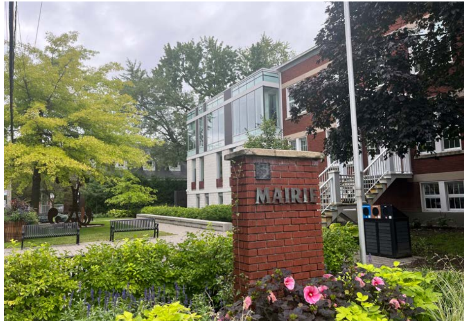
Des travaux seront effectués à la mairie de Saint-Basile-le-Grand.

« C'est toujours trop coûteux quand nous n'aurions pas dû les changer », commente le maire, Yves Lessard, devant les réticences émises par un citoyen, présent lors de la séance, à propos d'une telle dépense. « Les interrupteurs de lumières qui ont été ins-