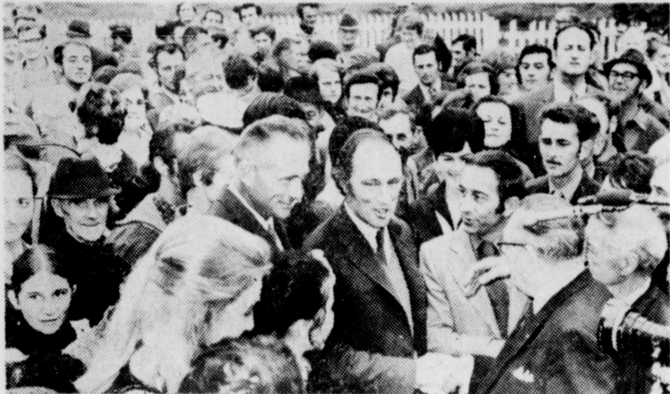
Le premier ministre se faisait un plaisir de serrer la main à tout le monde. On lui a entre autre présenté un vieillard de 90

tarderont pas à dire à l'école: "M. Pierre-Elliott Trudeau est venu dîner chez nous samedi".