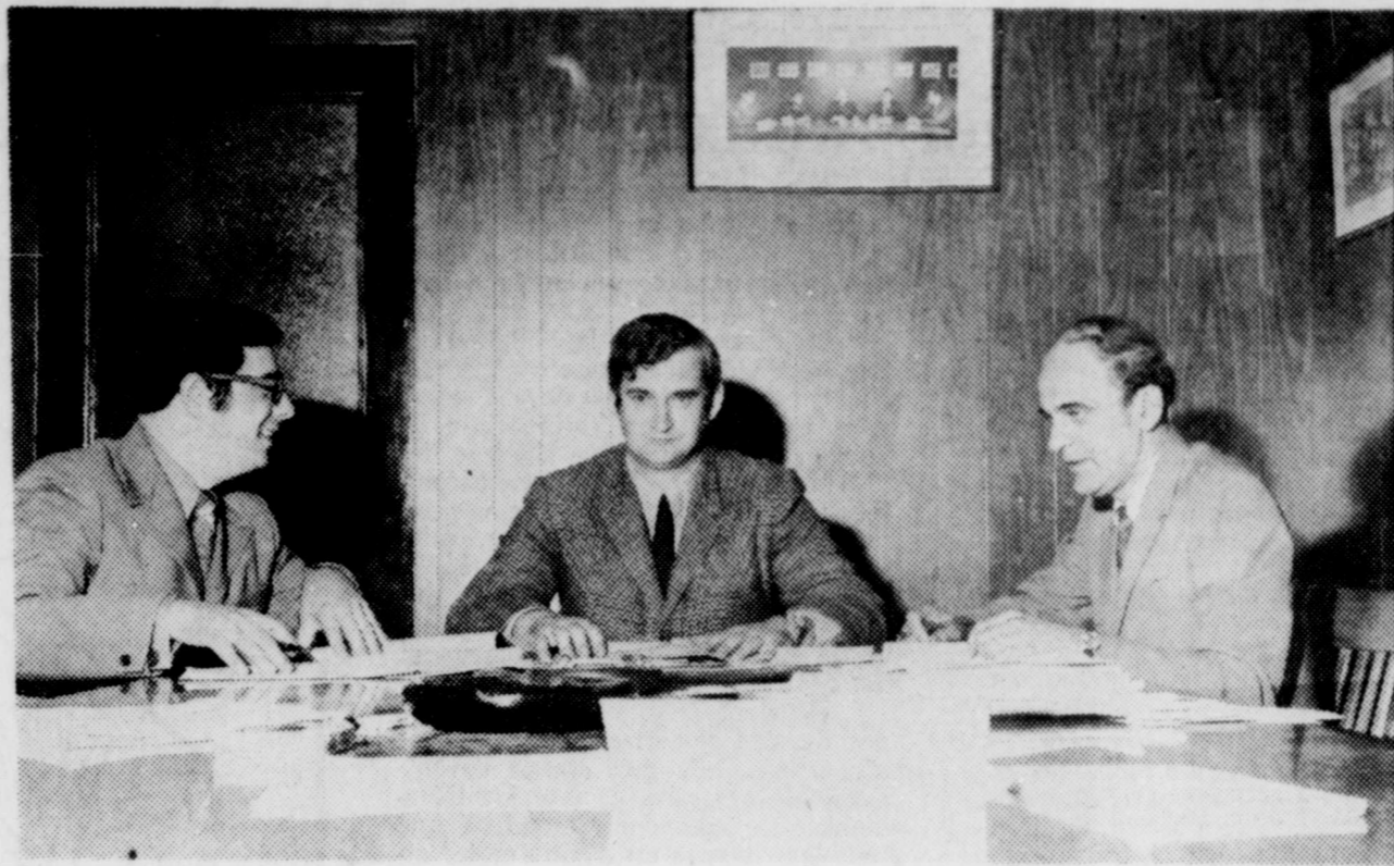
La Chambre de Commerce de Nicolet entreprend une nouvelle saison qui devrait être très prometteuse. Plusieurs priorités sont à l'agenda de l'organisme pour le terme 1970-71. Sur la photo de gauche à droite, MM.