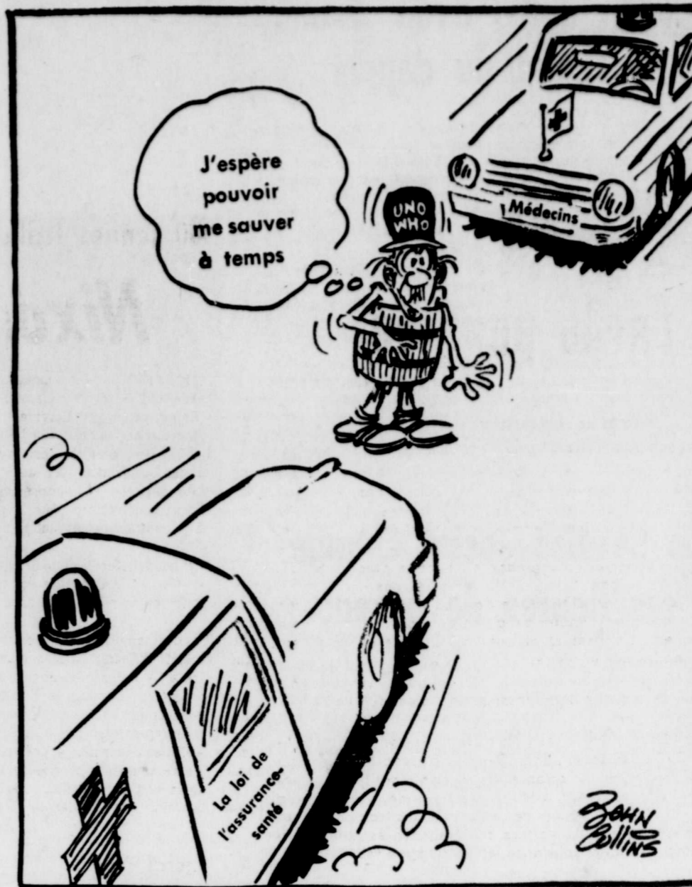
Une collision est à prévoir