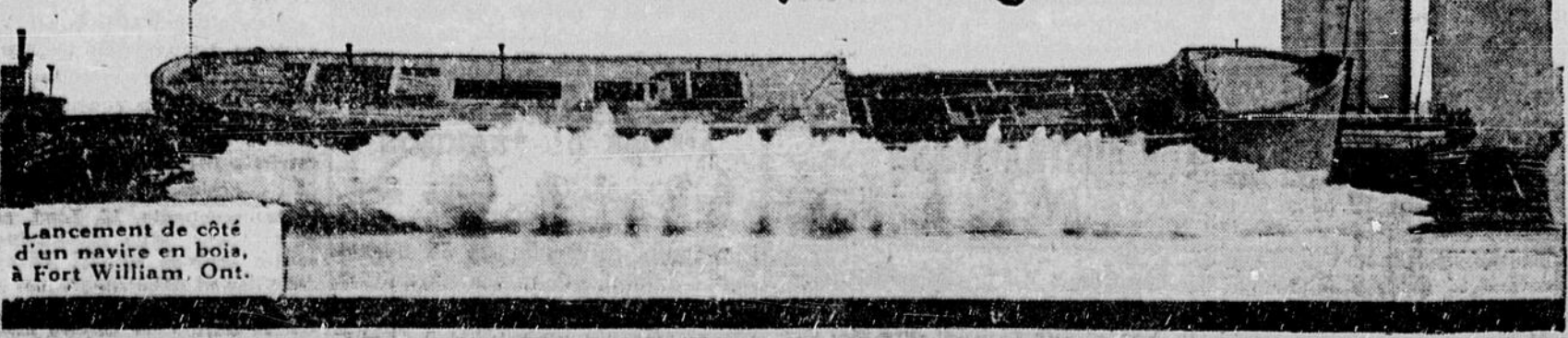
Lancement de côté d'un navire en bois, à Fort William, Ont.

Joignez un Chantier Maritime Si vous ne travaillez pas à l'agriculture