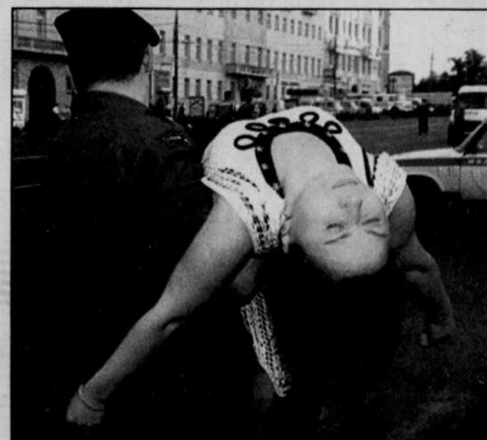
L'«attentat» a fait au moins huit morts et de nombreux blessés.