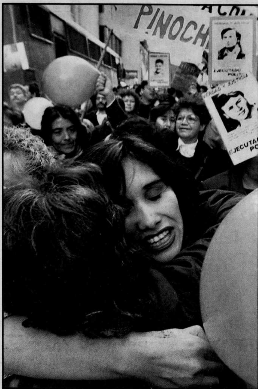
Des milliers d'opposants au dictateur ont manifesté leur joie à Santiago.