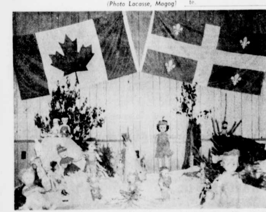
L'EXPOSITION organisée par les otéjistes de la municipalité d'Omerville présente plusieurs objets très intéressants aux visiteurs. Ci-haut, quelques poupées indiennes disposées sur un kiosque.