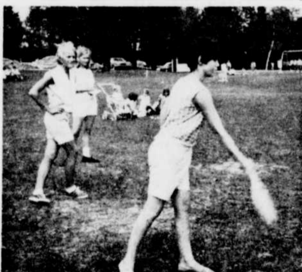
PALETTE BRULEE! — Un nouveau sport vient de faire son apparition sur les terrains de jeux du Grand Drummondville. Il s'agit de la palette brûlée. C'est un mélange de ping pong, de balle-molle et de baseball. Les règlements prévoient que 3 joueurs peuvent s'arrêter sur chacun des coussins formant un losange identique à celui d'un terrain de balle-molle normal. Ce sport monte en popularité auprès des jeunes filles qui l'ont adopté dès le début.