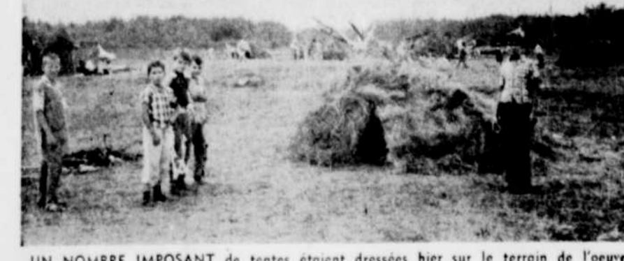
UN NOMBRE IMPOSANT de tentes étaient dressées hier sur le terrain de l'oeuvre des terrains de jeux à Omerville. On remarque sur la photo quelques-unes des habitations primitives ainsi que des membres de la tribu.