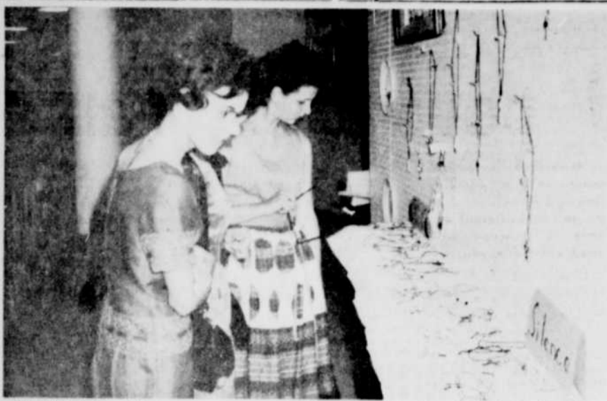
EXPOSITION. — Plusieurs parents ont défilé sur la mezzanine de la Caisse Populaire St-Frédéric, hier, afin de voir les travaux réalisés par leurs enfants depuis le début de la saison otéjiste, dans le domaine des arts. L'exposition se poursuit aujourd'hui et se clôturera demain soir.