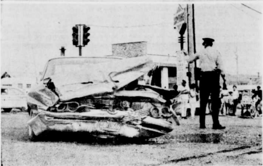
COLLISION — Deux automobiles se sont heurtées, à l'angle du boulevard Smith et de la rue St-Alphonse, hier, vers 5 heures p.m. La photo ci-haut fait voir l'état d'une des deux voitures impliquées dans cette collision.