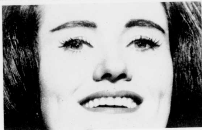
Joan Sutherland à "L'Opéra du Metropolitan"

12.00—Résumé Lecture de l'horaire détaillé de l'après-midi. 12.02—Tourbillon 1.00—Nouveaux disques Présentés par Lionel Daunais.