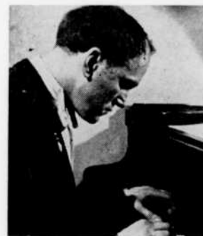
A 8 heures, "Concert" présentera notamment le pianiste Sviatoslav Richter et une oeuvre de Poulenc.

11.00—Les Pianistes célèbres Wilhelm Kempff. 11.30—Musique de nuit