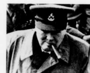
Les discours de Churchill à l'émission "Le monde parle au Canada", le dimanche 6 décembre à midi.