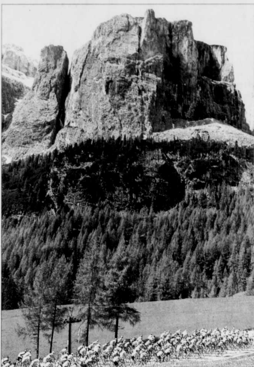
Photo prise lors du Tour d'Italie 2002.