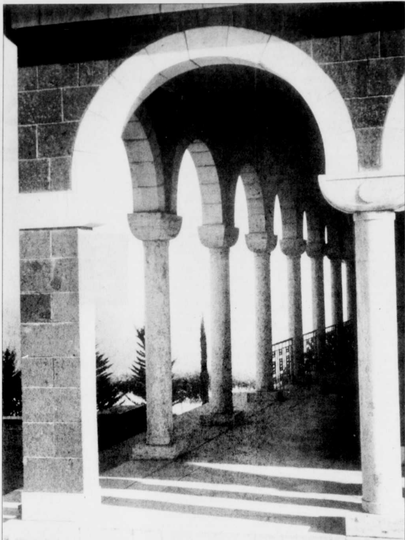
Le temple du mont des Béatitudes, symbole du site traditionnel du Sermon sur la montagne. Il offre une très belle vue sur le panorama de la tranquille mer de Galilée et des montagnes qui l'entourent.

Mais la plupart des chrétiens estiment que la cérémonie du baptême a la même importance quel que soit l'endroit du fleuve.