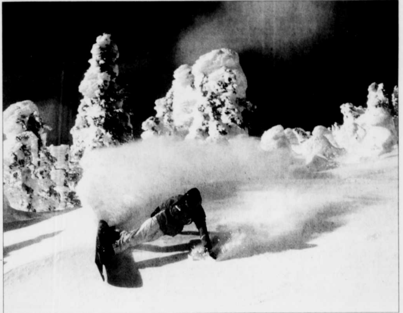
Autrefois, les planchistes étaient bannis des centres de ski.

Mais les skieurs sont maintenant aussi nombreux que les planchistes à