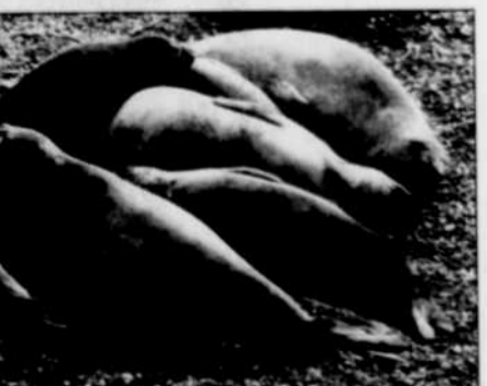
Des lions de mer au repos dans la péninsule de Valdes en Argentine.

À Terre de Feu, appelée ainsi par Magellan en raison des feux de camp allumés par les Indiens sur les rives lors de son passage, on est plus près de l'Antarctique que de Buenos Aires ou de Santiago.