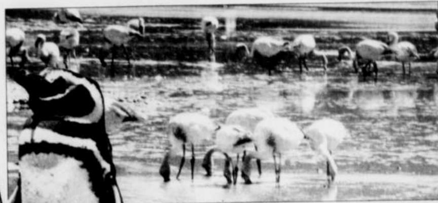
Flamants roses dans le parc Torres del Paine (Chili). Photo du bas : une vue du même parc, dont les grands pics rocheux dominent le paysage.