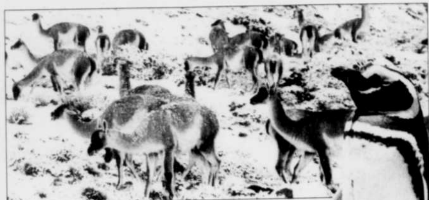
Guanacos dans le parc Torres del Paine (Chili). Au centre : manchots à Punta Tombo, Argentine.

◀ RAQUETTE ET OBSERVATION DES ÉTOILES AU PARC DU MONT MÉGANTIC F 8 LES PÉKINOIS PARTAGÉS SUR LA MORT DE LEUR CENTRE-VILLE HISTORIQUE F 3