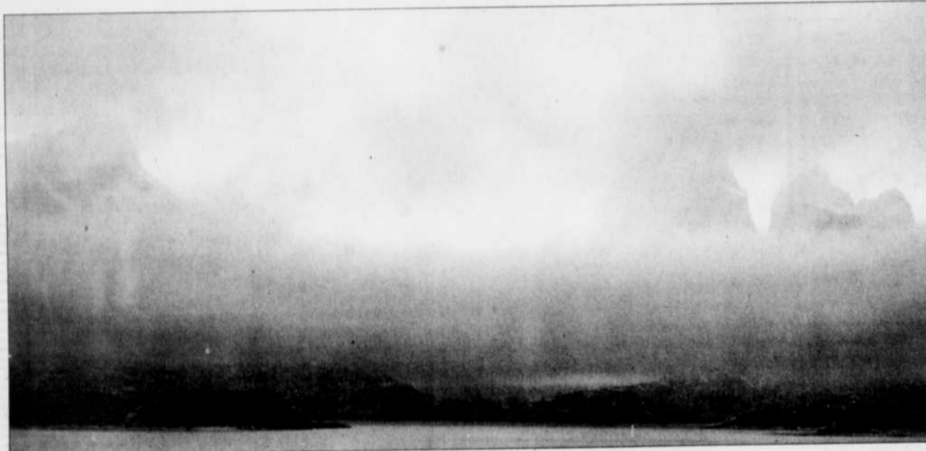
Le glacier Pingo recouvert de brume dans le parc Torres del Paine au Chili.