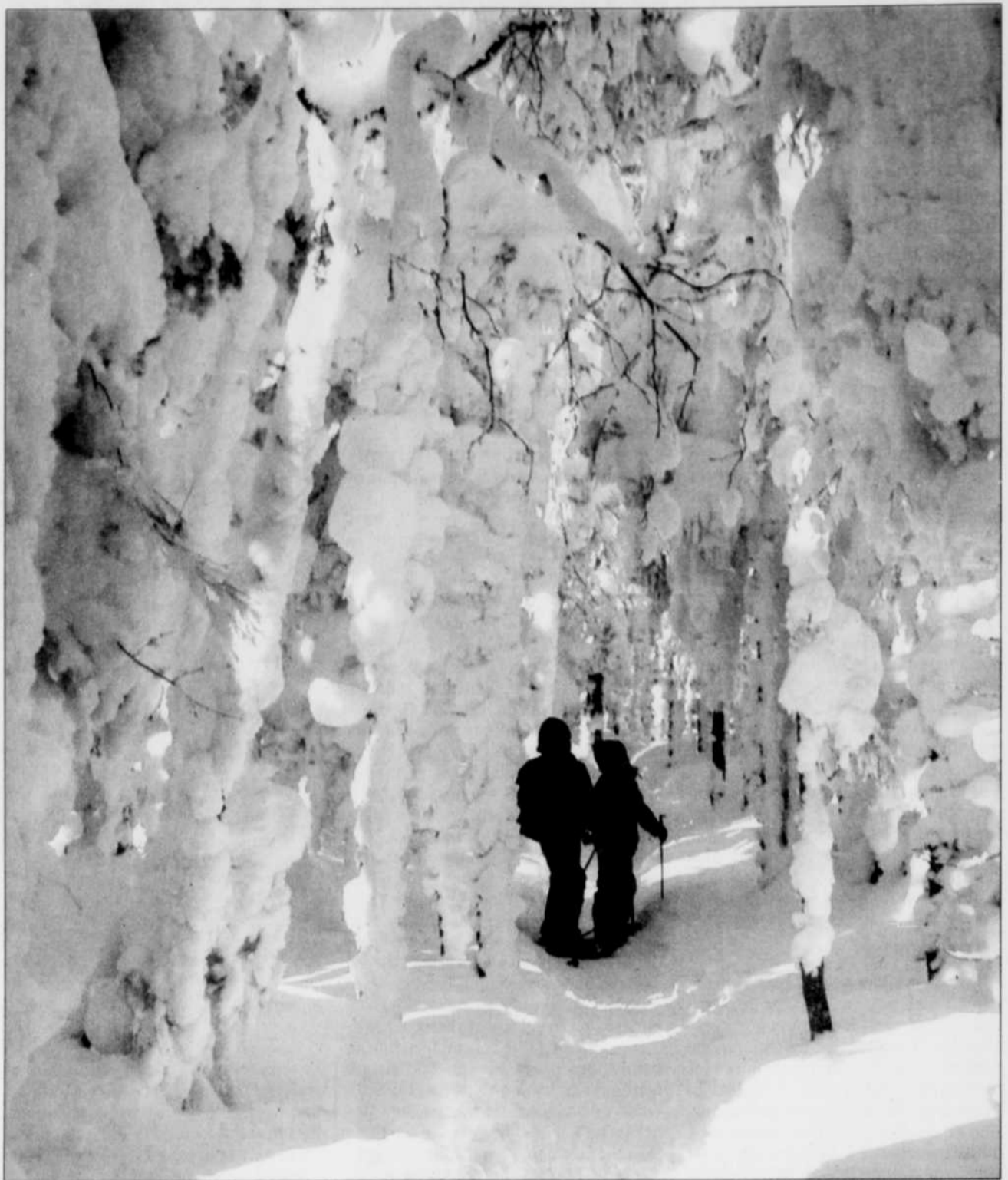
Il y a 28 kilomètres de sentiers de raquettes au mont Mégantic.