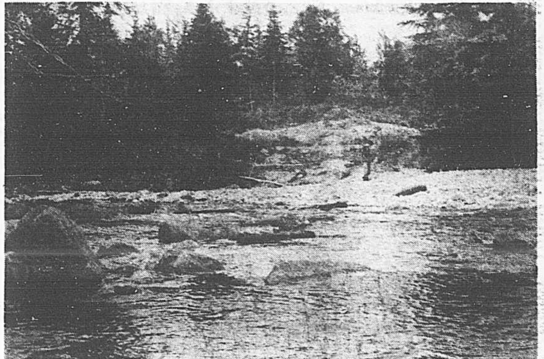
L'eau, la forêt, le sous-sol et la faune sont des richesses naturelles qui devraient être gérées par le même groupe.

Au cours des dix dernières années, j'ai vécu tellement de situations ridicules que je me demande sérieusement si l'on ne maintient