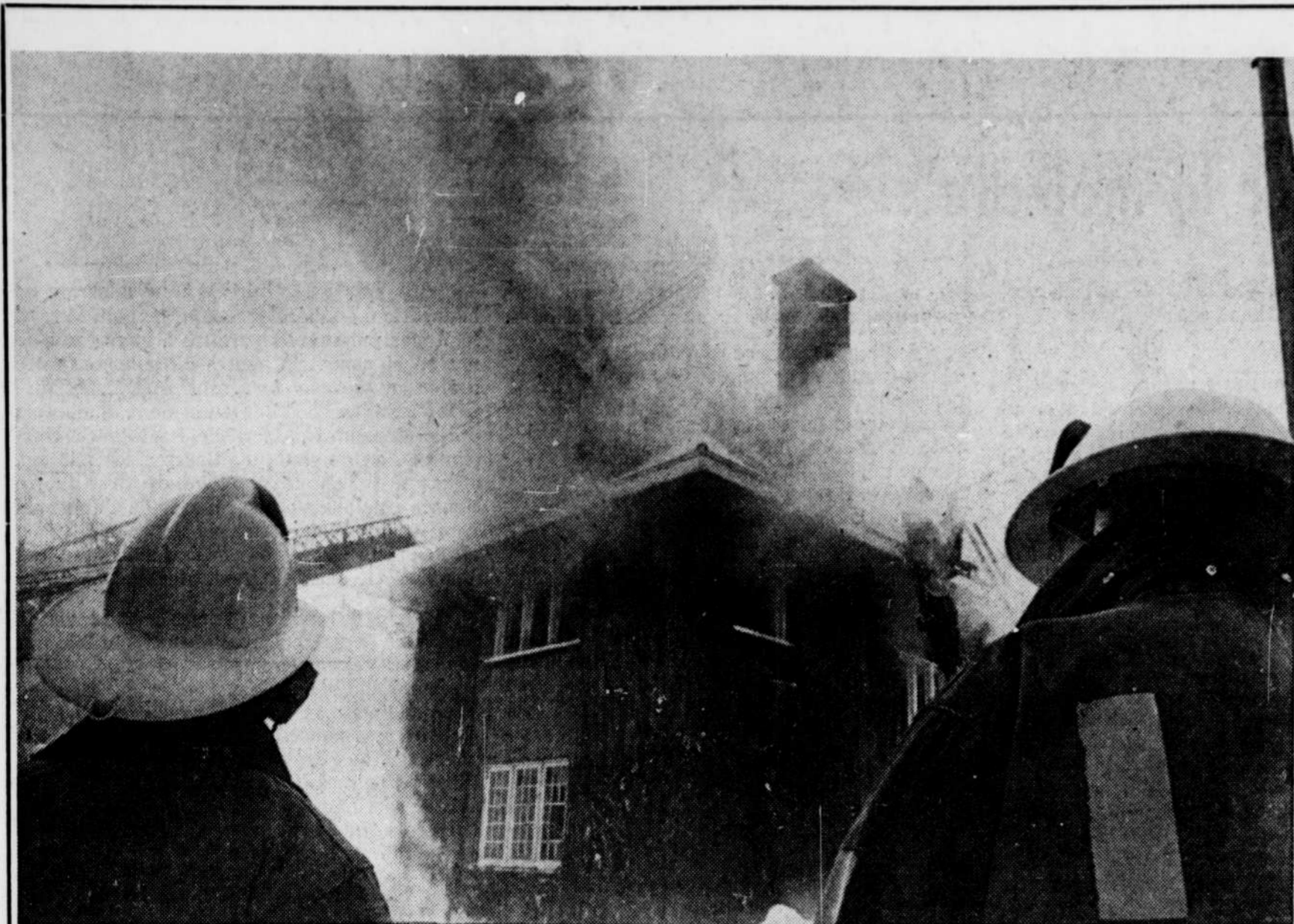
C'est souvent avec impuissance que les pompiers assistent à la destruction de propriétés par le feu. Plus de prudence pourrait sauver bien de l'argent.