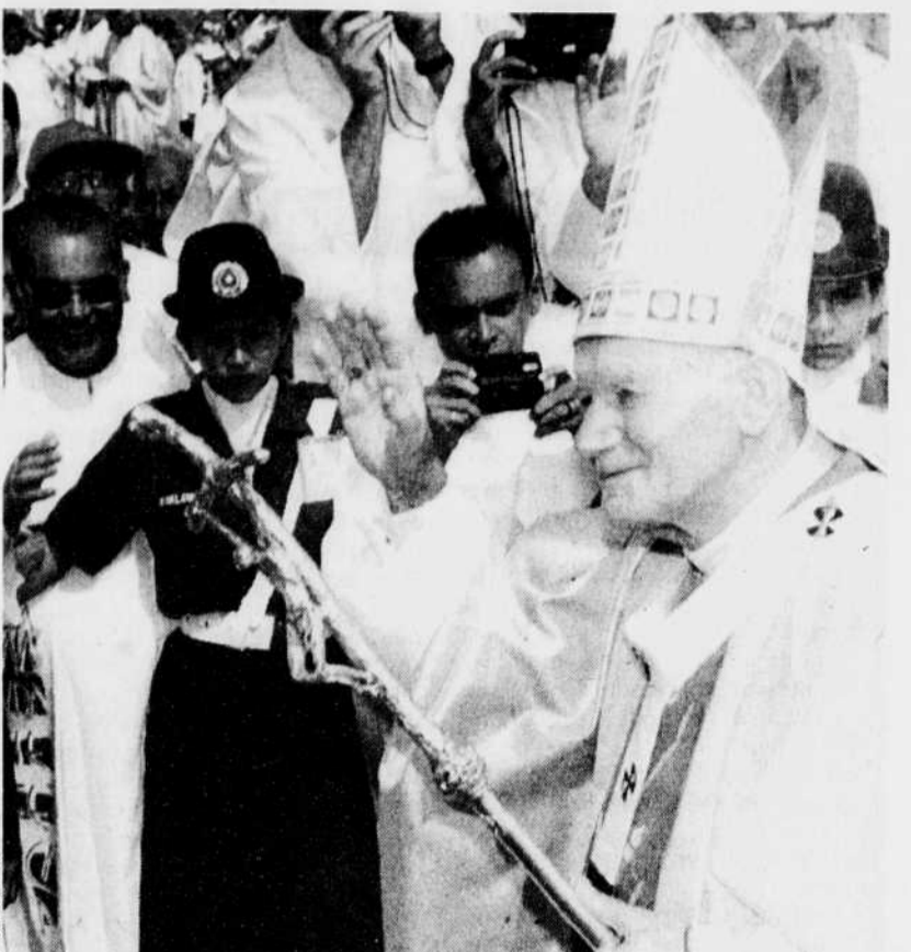
Le pape Jean-Paul II est accueilli par une foule de fidèles, au deuxième jour de sa visite au Brésil.

Le chef de cette «église», Edir Macedo, a récemment déboursé l'équivalent de 40 millions$ pour acheter une chaîne de télévision et faire pas-