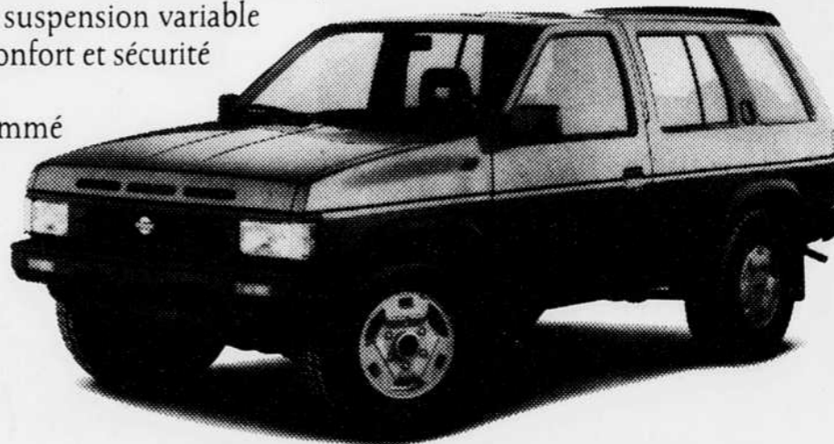
Pathfinder à partir de 19 890 $**

Alors, n'hésitez plus et venez jeter un coup d'œil sur le Pathfinder chez votre concessionnaire Nissan le plus près de chez vous.