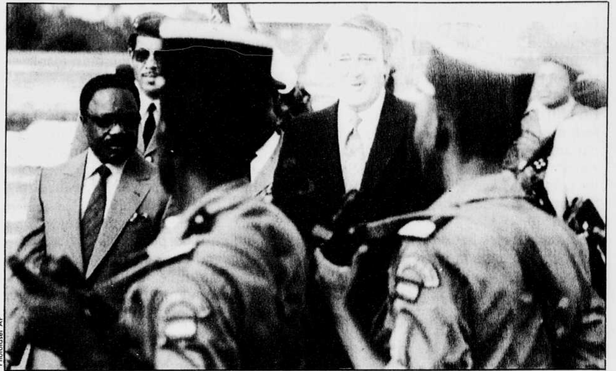
Accompagné du président Omar Bongo du Gabon, le premier ministre Mulroney a passé la garde en revue, hier, à son arrivée à Libreville.

Aujourd'hui, M. Mulroney aura des entretiens privés avec deux premiers ministres de pays du Commonwealth, Robert Mugabe du Zimbabwe et Robert Hawke d'Australie. Il rencontrera le premier ministre John Major de Grande-Bretagne demain et, jeudi, le président du Congrès national africain Nelson Mandela.