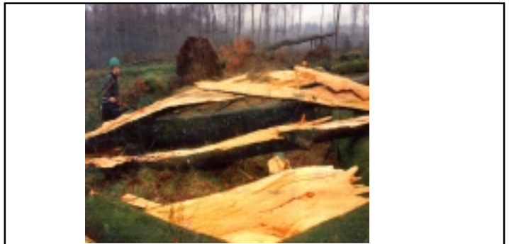
Fougères : 10 années de production forestière au sol

L'imprévisible, c'est enregistrer des vents de 173 km/h à Saint-Brieuc, de 151 km/h le lendemain à Belle-Île. Partout des inondations : de Tréguier dans les Côtes d'Armor à Lochrist dans le Morbihan ; de Châteaulin dans le Finistère à Redon (les plus importantes) en Ille-et-Vilaine. Les conséquences de l'imprévisible, c'est encore 70 % des foyers privés d'électricité dans les Côtes d'Armor ; 6 % du tissu forestier massacré en Ille-et-Vilaine. Et comme dans toute catastrophe, le cortège des victimes avec cinq morts en Ille-et-Vilaine et un en Loire-Atlantique.