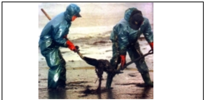
Deux militaires de l'Aisne sur le littoral Atlantique

L'imprévoyance avec l'Érika ? Curieusement, il se dégage aujourd'hui une unanimité pour constater que l'Europe tolère encore ce que les États-Unis interdisent strictement : la navigation de bateaux poubelles près du littoral. Les leçons de l'Amoco Cadiz (1978) n'avaient-elles donc pas suffi ? À quoi bon crier haro sur les pavillons de complaisance pour constater que c'est la Compagnie Total qui se cache derrière ? 1 400 tonnes de déchets ramassées dans le Finistère, 13 000 dans le Morbihan, 75 000 en Loire-Atlantique, auxquelles il faut ajouter les 26 000 tonnes de Vendée et de Charente-Maritime. Une autre statistique ? Sur 60 000 oiseaux recueillis - la pointe de l'iceberg ? - 12 000 seulement étaient vivants et 9 000 ont survécu. D'après les ornithologues, c'est bien l'Érika qui détient le triste record en la matière. Et depuis, de drôles de rumeurs courent sur la nocivité des produits rejetés