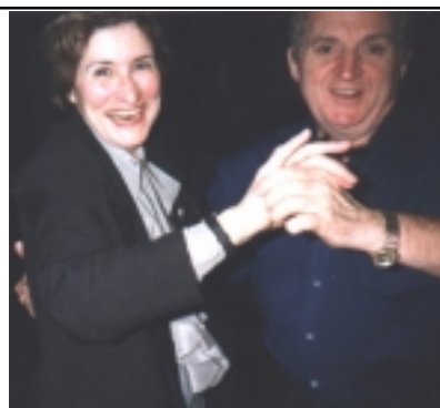
L'état-major avait montré l'exemple !