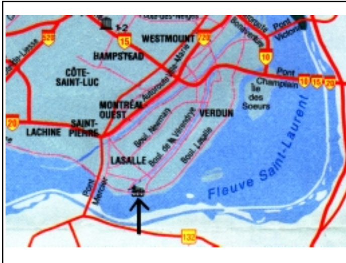
Plan de situation du Parc des Rapides à LaSalle

20 danseurs et 2 sonneurs en costume local