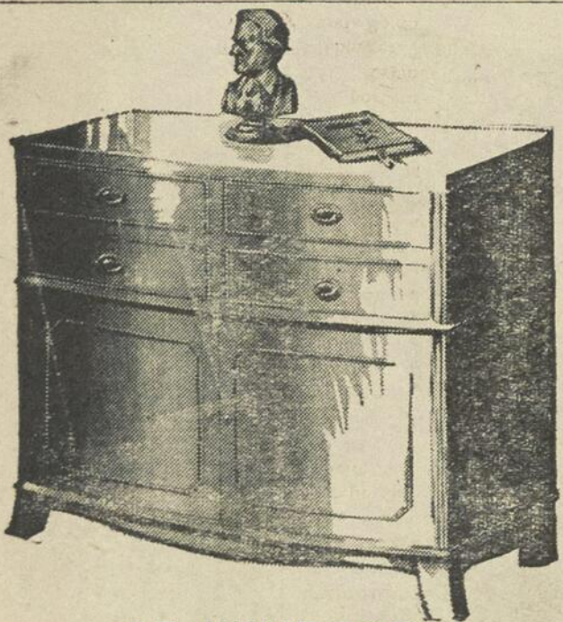
LE WINDSOR Radio-Phonographe automatique Westinghouse Modèle RA1605

Voici le plus nouveau et le plus complet des instruments modernes, le "Windsor" un superbe appareil de 16 lampes, qui apporte au foyer tous les divertissements qu'offre la radio et le disque. Vous avez ici la plus récente merveille radiophonique la "Fréquence modulée" (brevet Armstrong authentique) qui assure une sonorité naturelle sans aucune statique — la bande standard et les trois bandes élargies aux ondes courtes — un phonographe automatique de haute qualité — le tout dans un meuble de style Hepplewhite authentique, qui dissimule ingénieusement le caractère mécanique de l'instrument. Le Windsor, dont la face gracieusement courbée est bien caractéristique de l'époque Hepplewhite, est fait de noyer au dessin sobre; le dessus est une table de noyer solide. Il s'obtient aussi en acajou rouge vin avec dessus en bois solide. Les qualités sonores et le rendement ont les mêmes que ceux du "Sherwood".