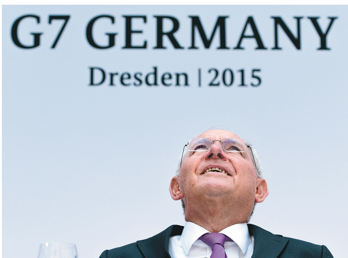
Le ministre des Finances de l'Allemagne, Wolfgang Schäuble, l'hôte du sommet qui s'est tenu durant deux jours à Dresde

Pour le pays, qui doit l'an prochain présider le G20, il s'agirait d'une reconnaissance