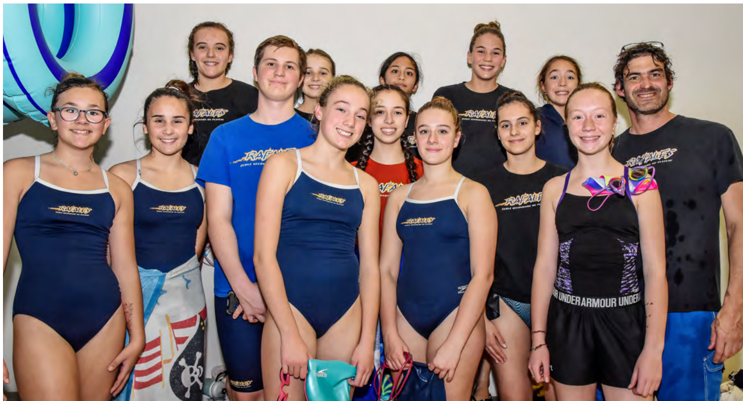
Les nageurs des Rafales de l'école secondaire du Plateau présents lors de la compétition du 26 octobre.

Le club de l'École secondaire du Plateau, les Rafales, se portent bien lui aussi avec un peu plus d'une vingtaine de