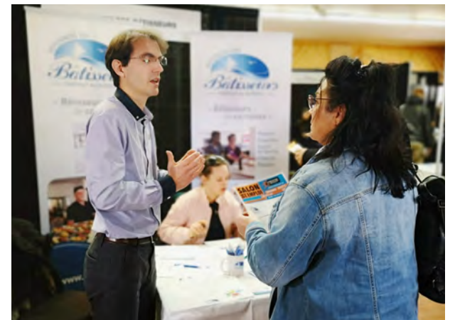
Les populaires résidences des Bâtisseurs sont aussi en recrutement. À Charlevoix au Boulot!, ils ont présenté leurs opportunités de carrières : préposés aux bénéficiaires, serveurs et infirmiers auxiliaires sont entre autres recherchés.