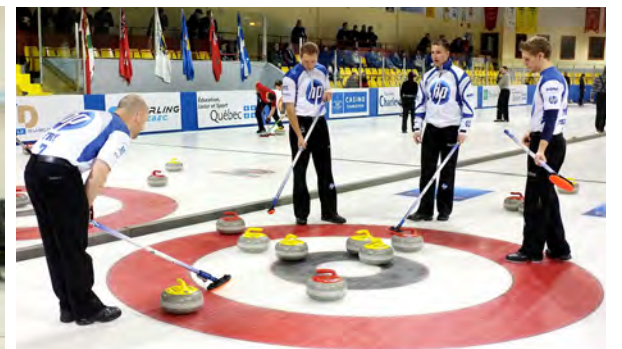
Le légendaire Brad Gushue, médaillé d'or olympique en 2006, a aussi fait un détour par Clermont, notamment en 2011.

L'aventure du Challenge Casino de Charlevoix débute à l'été 2000, alors que François Tremblay, directeur général de la maison de jeux, caresse un ambitieux projet : accueillir dans la région l'un des plus importants événements de curling dans l'est du Canada.