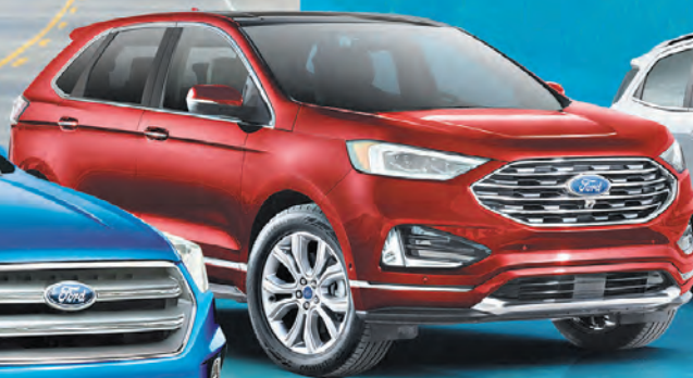
EDGE 2019 TITANIUM