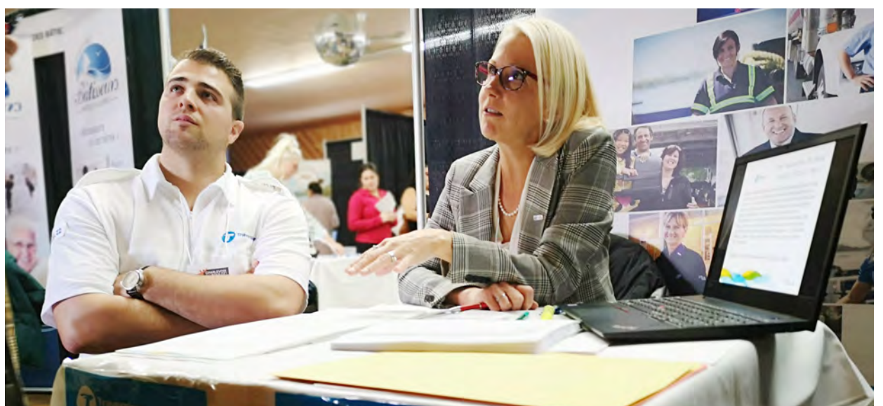
Lors de sa campagne « Vague d'embauche », la Société des traversiers du Québec s'est affichée au salon de Saint-Hilarion et voulait combler ses postes vacants sur la traverse L'Isle-aux-Coudres/Saint-Joseph-de-la-Rive. Des mécaniciens, des auditeurs internes et un capitaine manquent à l'appel.