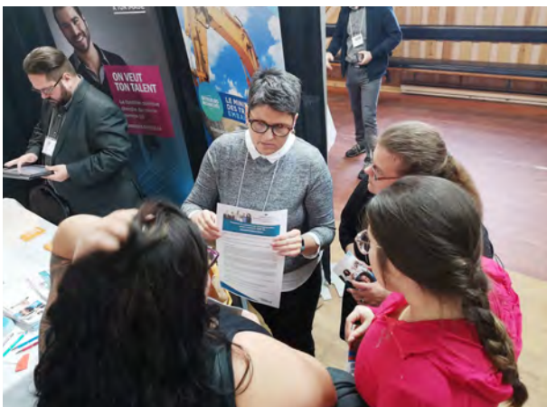
La fonction publique du Québec est venue démystifier son processus d'embauche. En effet, pour travailler au sein d'organismes gouvernementaux, il faut s'inscrire sur le portail Carrières.gouv.qc.ca et passer un examen spécial.