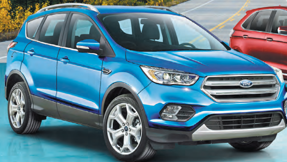
ESCAPE 2019 TITANIUM

SUR LES VUS FORD 2019 NEUFS SÉLECTIONNÉS