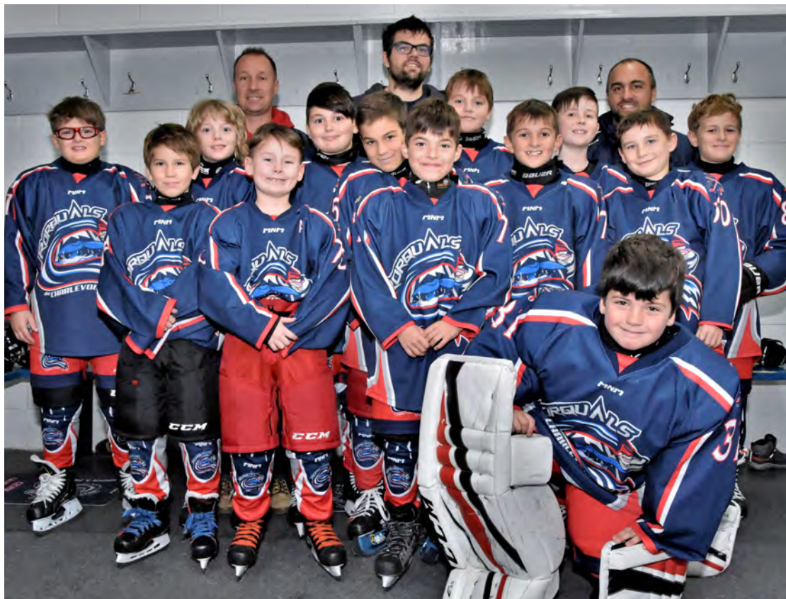
L'équipe atome B les Rorquals Simard Suspensions.

Les Caribous ont eu le dessus 4 à 2 dimanche sur les Rorquals Solugaz. « La partie a bien été. Les Caribous sont une équipe assez forte et on s'attendait à un match serré et ç'a été le cas. Il y a eu un petit relâchement en deuxième période, mais les jeunes se sont repris en