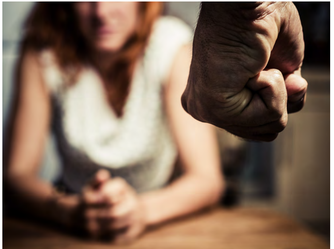
Selon le CALACS, deux femmes sur cinq ont été victimes d'agression sexuelle dans Charlevoix.

Pour utiliser leurs services gratuits et confidentiels : 1 888 933-9007 (24/7) ou le 418 665-2999.