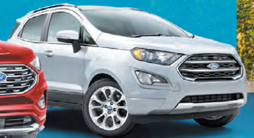
ECOSPORT 2019 TITANIUM