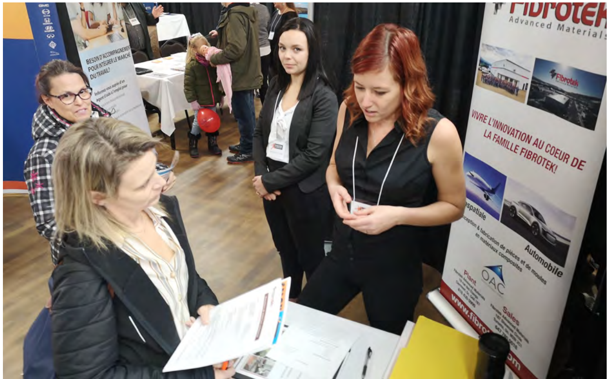
L'entreprise spécialisée en fibre de carbone Fibrotek – Advanced Materials de Clermont a tenté de recruter des manoeuvres de matériaux composites, finisseurs-assembleurs, et une foule d'autres postes dans leur organisation.