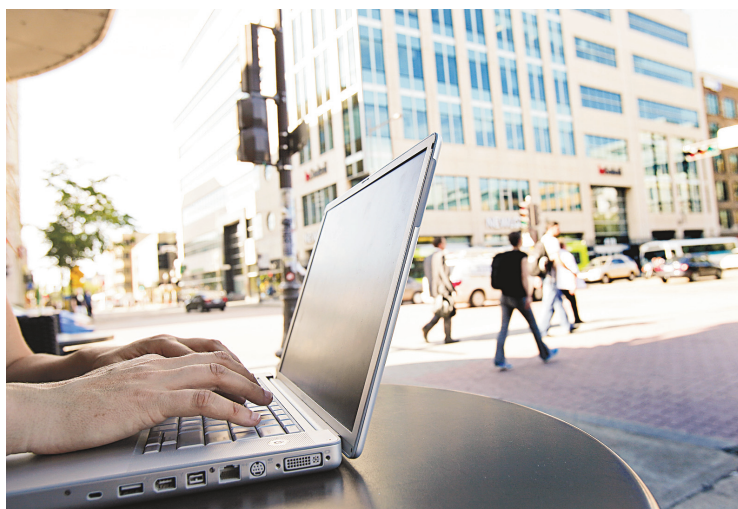
YAN DOUBLET LE DEVOIR

La modernité n'est pas avare de surprises. En amenant l'humain à cultiver l'instant, l'exhibitionnisme et l'hyperconnectivité, elle a aussi fait apparaître dans les villes et les campagnes un espace d'expression insoupçonné formé par les milliers de réseaux Internet sans fil qui pullulent désormais pour permettre à l'internaute de base d'assouvir ses nouveaux besoins numériques. Des réseaux privés, provenant de résidences tout aussi privées, baptisés selon l'humeur,