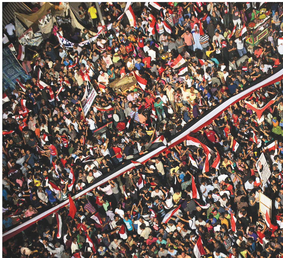
Des centaines de milliers d'Égyptiens réclamaient depuis dimanche le départ de Mohamed Morsi au cours de manifestations d'une ampleur sans précédent depuis la révolte qui a renversé le président Hosni Moubarak en 2011.