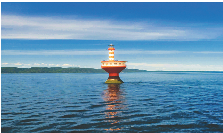
PEDRO RUIZ LE DEVOIR

L'exploration des hydrocarbures dans le golfe du Saint-Laurent inquiète les élus et les citoyens.