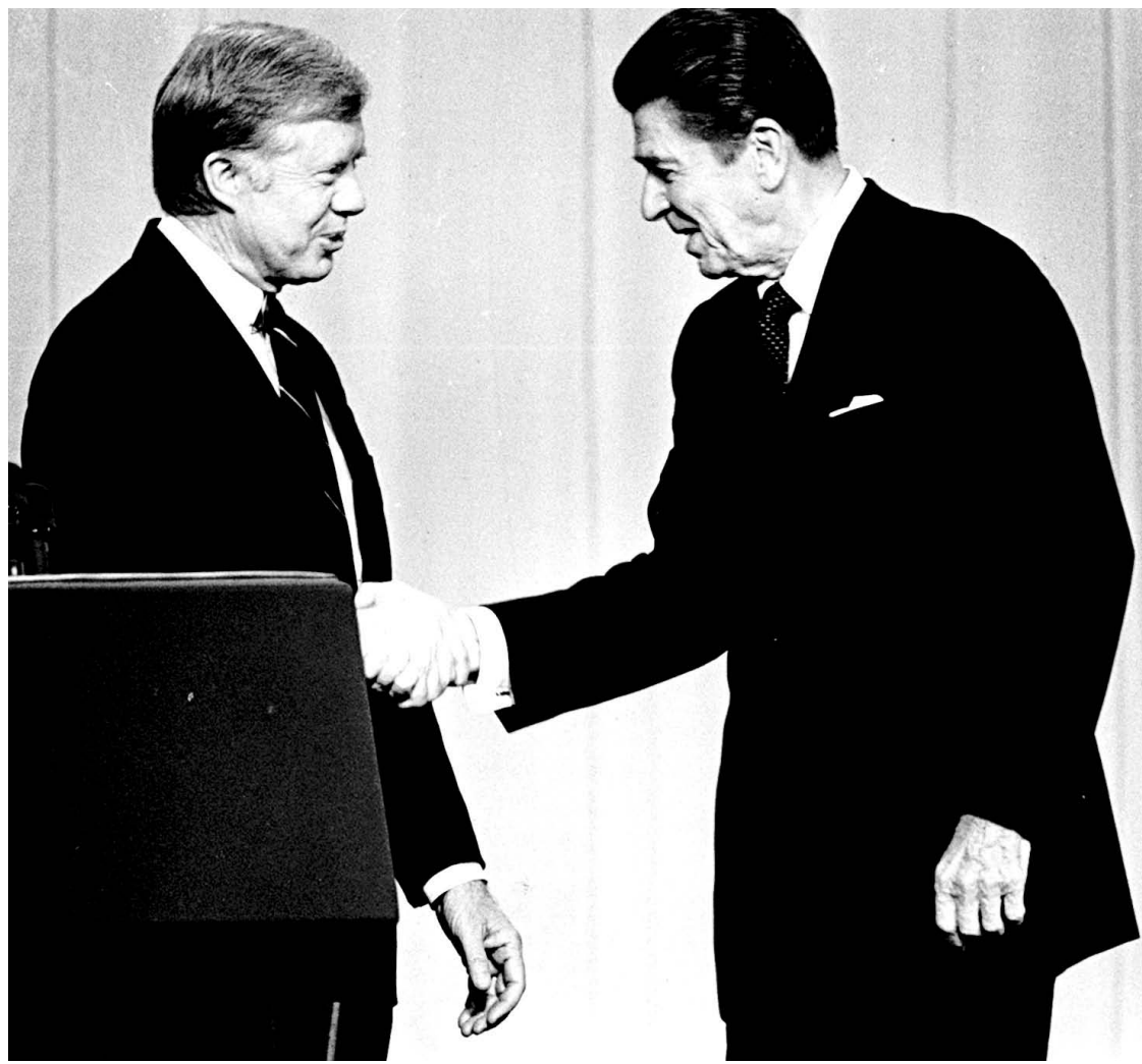
Jimmy Carter (à gauche) et Ronald Reagan, lors d'un débat présidentiel télévisé en octobre 1980. Contrairement à ce qu'on pense parfois, le moment décisif ne fut pas l'arrivée au pouvoir du républicain Ronald Reagan. Déjà sous le gouvernement démocrate de Jimmy Carter, une mobilisation sans précédent du milieu des affaires avait suscité une révolte fiscale (anti-impôts) et enclenché le début de la déréglementation.

Les efforts concertés des grandes entreprises et des nantis influencent dorénavant tous les aspects du gouvernement américain. Ces efforts incluent non seulement le lobbying direct des élus, mais aussi des cam-