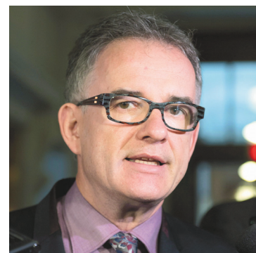
JACQUES BOISSINOT PC