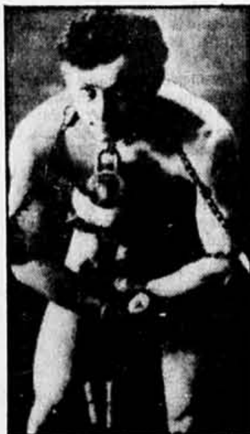
Harry Houdini à son meilleur.