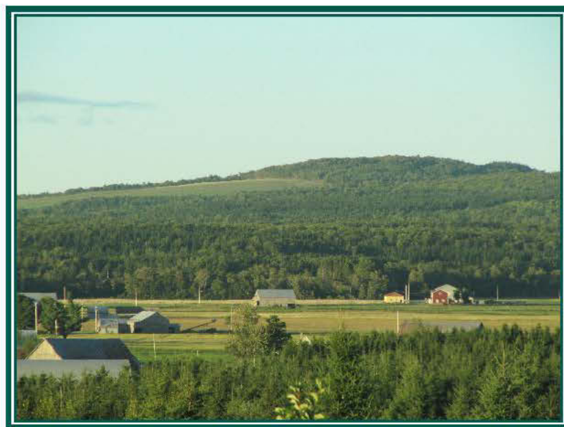
Le rang des Pointes

Émilie Doyon, conseillère Viactive 418-883-3699 ou sans frais 1-877-935-3699