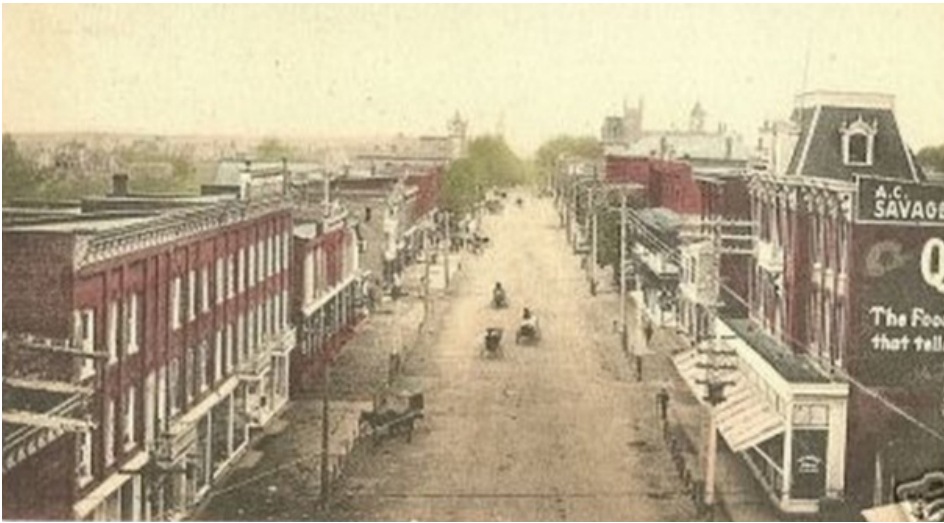
Granby en 1910