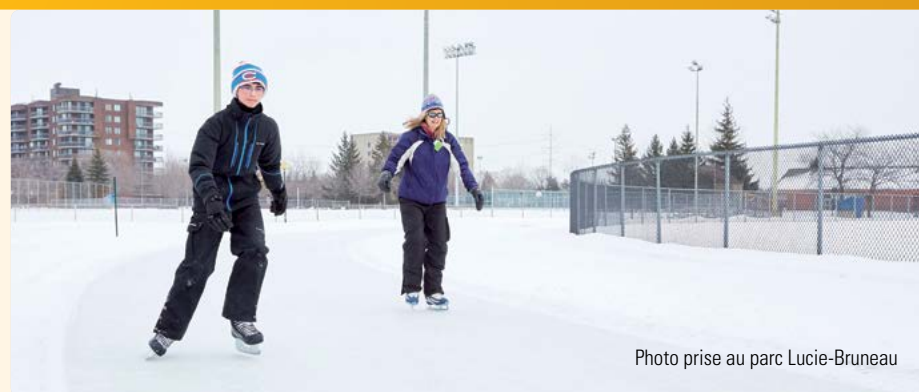
Photo prise au parc Lucie-Bruneau

Des pavillons chauffés sont aménagés dans tous les parcs et une surveillance des lieux est assurée durant les heures d'ouverture.