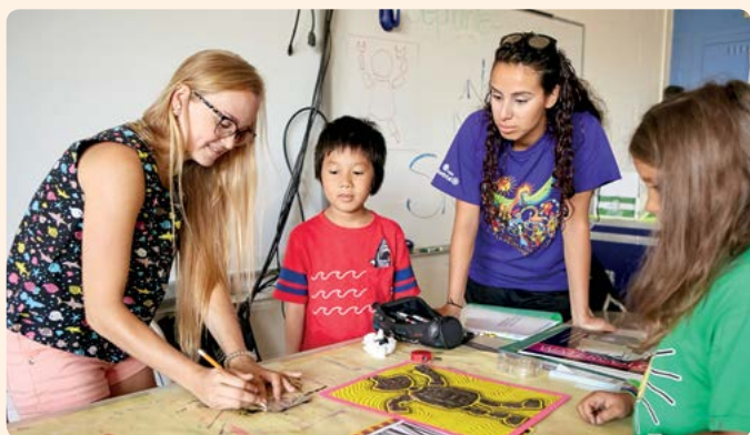
Photo prise lors des Ateliers-Soleil 2017 / Camp spécialisé en arts plastiques