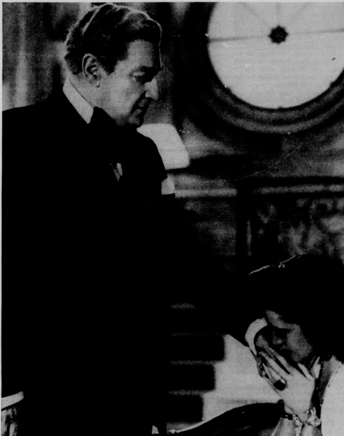
Sacha Guitry, comédien et fils de comédien

La jeune fille s'essaie sur les planches et elle échoue. Le Comédien la sacrifie alors à sa passion du théâtre.