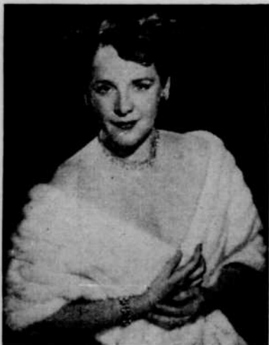
ELEANOR STEBER, soprano, qui sera soliste avec l'orchestre symphonique de New-York, dimanche, et qui chantera, samedi, dans "Lohengrin".

Brahms a lui-même souligné qu'il avait, dans son double concerto, tenté d'appliquer la forme du concerto grosso. C'est ainsi que les parties confiées aux deux solistes alternent avec les tutti de l'orchestre.