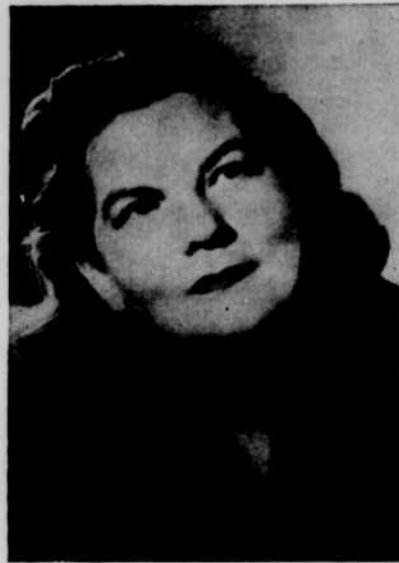
MARGARET HARSHAW, l'excellent soprano américain que l'on entendra au concert symphonique de mardi soir et, samedi après-midi, avec la troupe du Metropolitan Opera.

On remarque également le Chant du Cygne , le Récit de Lohengrin et l' Adieu d'Elsa.