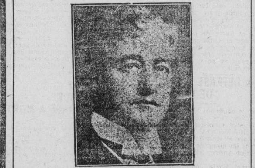
PAUL DUFAULT Le sympathique ténor canadien

vient de créer un nouveau disque en français pour la compagnie COLUMBIA :