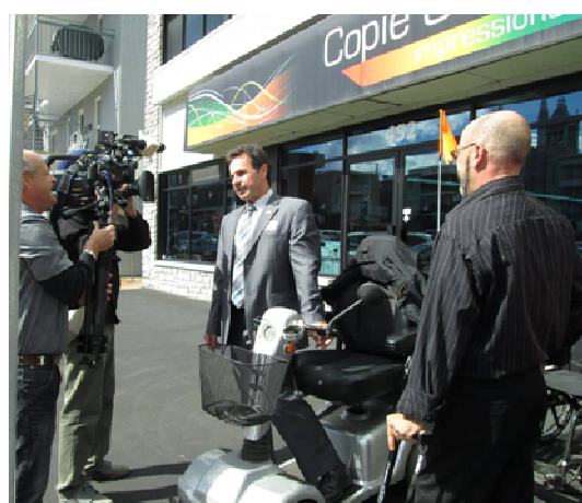
Mission accomplie, mini-rallye réussit !!!

Pour la 3 e année consécutive, H.S.I. permet à des participants de différents milieux de se mettre dans la peau de personnes vivant avec des limitations. Encore une fois, le mini-rallye ne laisse personne indifférent face aux problématiques quotidiennes de nos membres. Une activité de sensibilisation qui aura porté fruit pour les travaux du bas de la ville de Shawinigan. Dossier à suivre. ;)