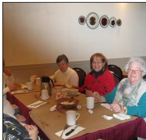
Le party est pogné au Restaurant Auger!! Repas convivial, chant et danse étaient au menu.. Que de plaisir en bonne compagnie!!! ☺