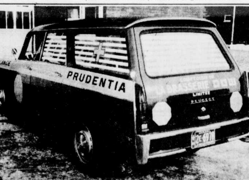
AMBULANCE — Cette ambulance, offerte gracieusement par Prudentia et la brasserie Dow, sera au service des blessés dans les limites de la cité. Ce sont les constables de Drummondville qui seront chargés d'opérer le véhicule.

A l'heure actuelle, huit autres véhicules semblables à celui de la cité ont été ainsi offerts par les deux mêmes organismes.