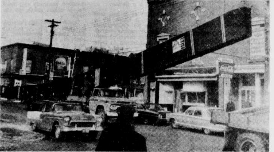
CHARGEMENT ENCOMBRANT. — Des poutres de 135 pieds de long, en forme d'arc et juchées sur un fardier, constituent un chargement encombrant surtout quand il faut, pour les rendre à destination, traverser le centre commercial d'une ville. Voici les poutres devant servir de super-structure de la passerelle de la Commission scolaire de Coaticook alors qu'on les fait passer sous des fils électriques sur la rue Main.

Lors des premières tentatives pour hisser ces poutres à bord du fardier, des câbles d'un pouce de diamètre qui avaient été installés en ceinture pour les supporter se sont brisés et ont compliqué le travail des employés. Au cours de l'avant-midi d'hier, cependant, le fardier et son chargement ont pu traverser la ville en empruntant la rue Main. Les fils téléphoniques et électriques ont cependant ralenti la progression du chargement car il a fallu tous les relever pour laisser passer les poutres.