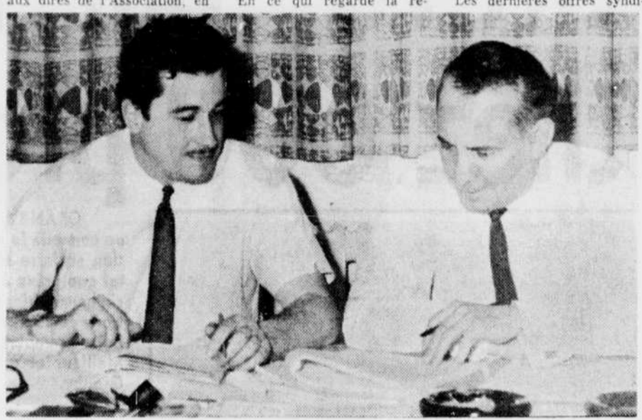
NEGOCIATEURS — Les deux parties en cause dans le conflit qui oppose les professeurs aux commissions scolaires de la région de Granby, ont vainement tenté d'en arriver à une entente et les enseignants ont décidé de déclencher la grève ce matin.

"Dans ce cas, nous serons obligés de retourner vos enfants à domicile. De plus, il est important de noter que les écoles demeureront ouvertes et que les enfants doivent s'y attendre à 8h. 20 le matin et l'après-midi à 1 heure. Avant ces heures, les portes seront fermées à clef. En ce qui concerne les diners, tous les enfants qui le peuvent doivent le prendre à domicile", a dit Me Légaré.