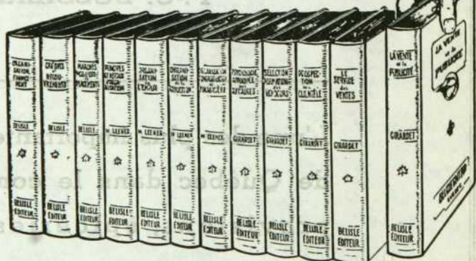
RELIURE BLEUE — TITRES DORES

Pour le propriétaire, le gérant ou les chefs de services