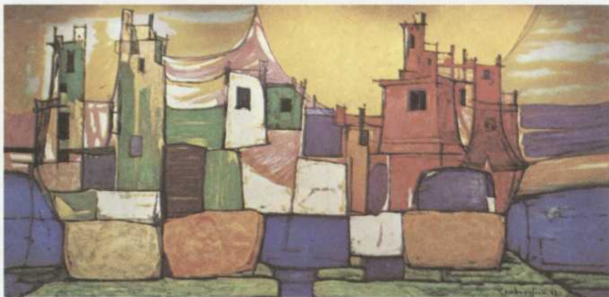
Peinture de Paul V. Beaulieu Théâtre Port-Royal