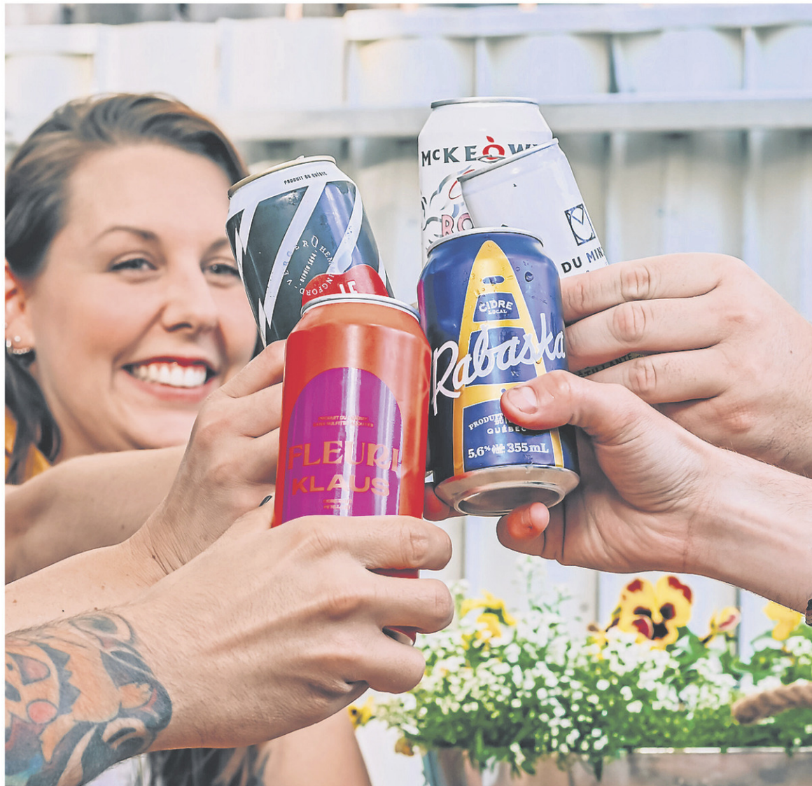
De nos jours, le cidre en canette n'a rien à envier au cidre embouteillé.

Gala et Dolgo, ce cidre a la particularité d'être fermenté dans la canette pour une prise de mousse naturelle. Les levures utilisées sont les mêmes qu'on utilise pour des bières de type « Sauvage », soit les Brettanomyces clausenii .