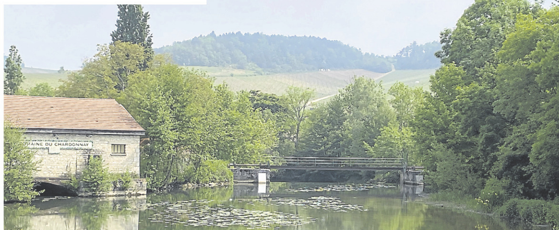
La colline des Grands Crus vue du village de Chablis sur les rives du Serein.

Pour des suggestions quotidiennes de vins, suivez-moi sur Instagram @nartdevivre ou sur mon site natalierichard.com.