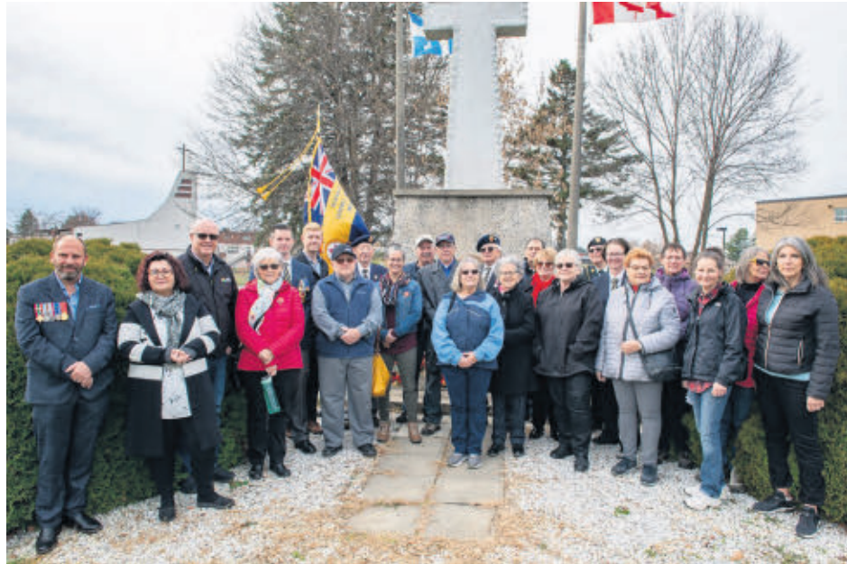
La Filiale 041 de la Légion Royale Canadienne à tenue une cérémonie hommage au Cénotaphe de Val-des-Sources le 11 novembre dernier et à laquelle ont pris part plusieurs personnalités des milieux politiques et communautaires, dans le cadre du Jour du Souvenir.