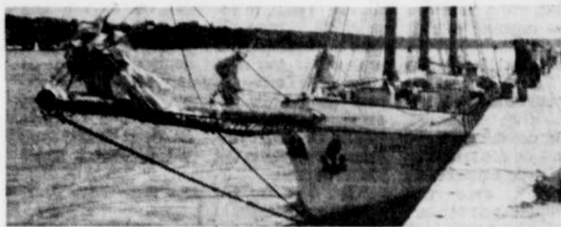
L'Empire Sandy est à Québec depuis hier matin. La population pourra voir ce trois-mâts goélette jusqu'à dimanche matin, dans le bassin intérieur du Vieux-Port de Québec.

Mesurant exactement 196 pieds hors tout, le plus grand des voiliers canadiens devait faire son apparition à Québec dimanche dernier. Son retard de quatre jours est dû au bris d'une bôme et d'une