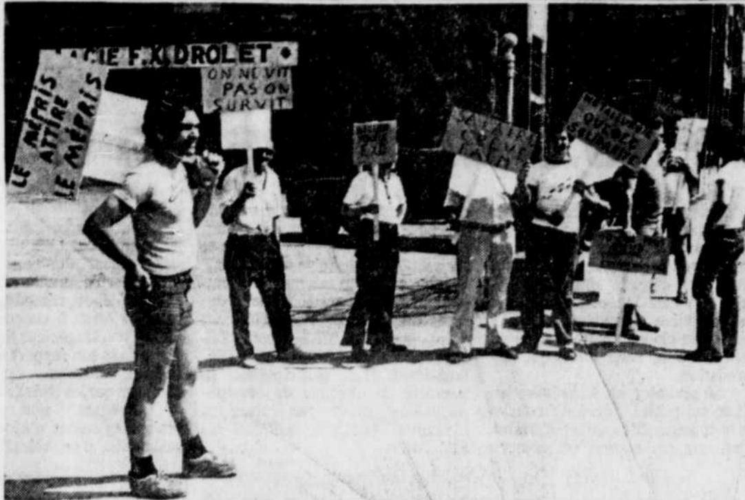
Le travail pourrait reprendre dès lundi dans les entreprises de métallurgie de la région de Québec à la suite d'une entente intervenue mercredi.

VOYEZ LE CAHIER PUBLICITAIRE DE • IGA • SEARS INSÈREZ DANS CE JOURNAL