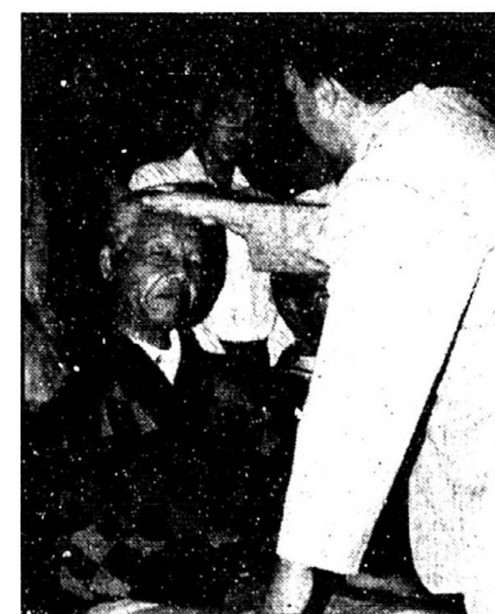
Nelson Mandela était en visite au Natal, hier.

À l'issue de 48 heures de discussions internes, l'Alliance a précisé qu'elle présenterait aujourd'hui au gouvernement