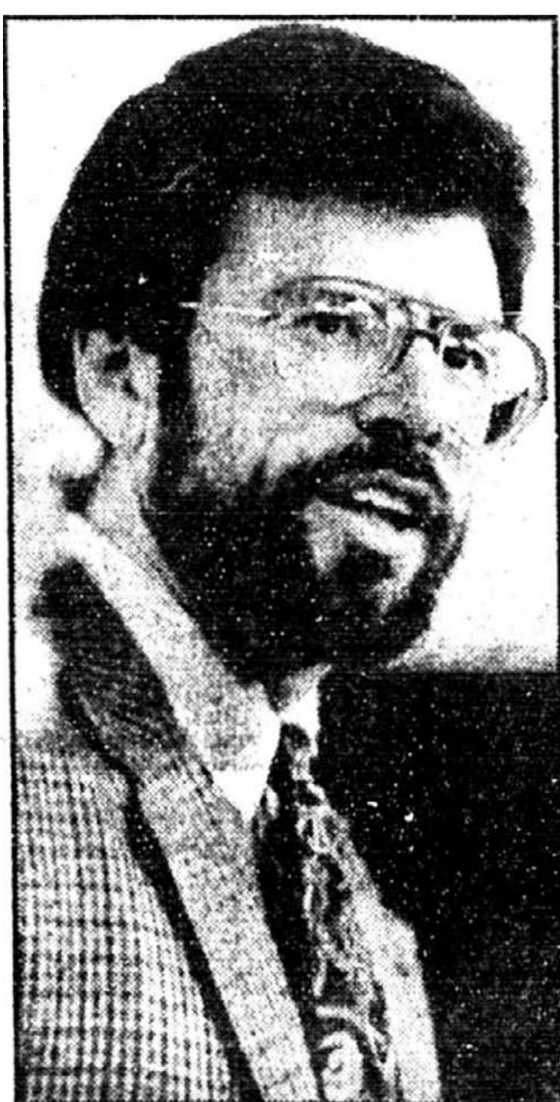
Gerry Adams, président du Sinn Féin

Adams a par ailleurs confirmé que «des membres du Sinn Féin ont été en contact prolongé et ont dialogué avec le gouvernement britannique» mais ajouta que ces contacts ont été interrompus par John Major «sur ordre de ses al-