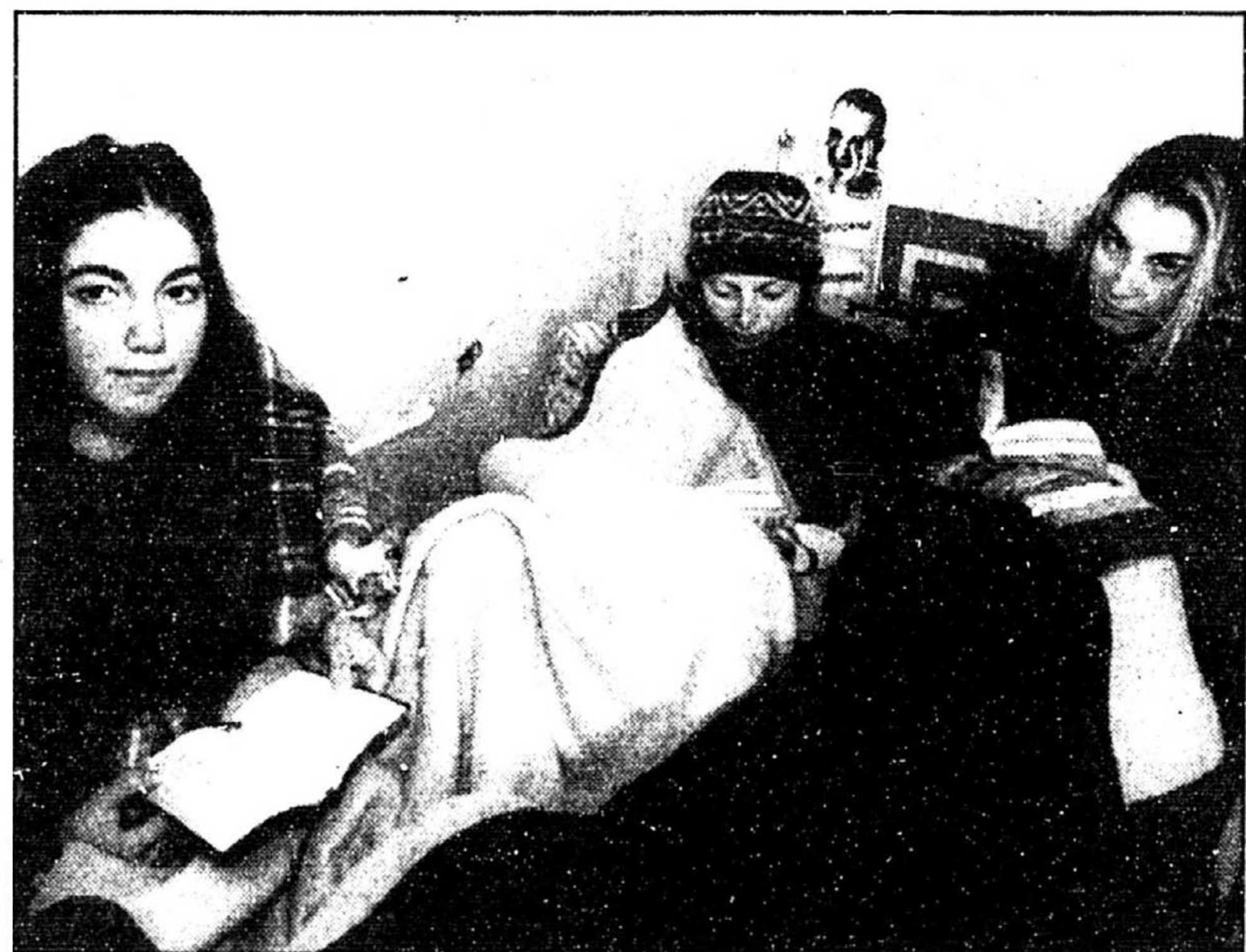
Emmitouffés, ces étudiants de l'Université de Belgrade se serrent les uns contre les autres pour lutter contre le froid dans un hôtel sans chauffage.

charge le fonctionnement des deux hôpitaux abandonnés par le personnel religieux musulman qui a fui, craignant les attaques des forces croates.