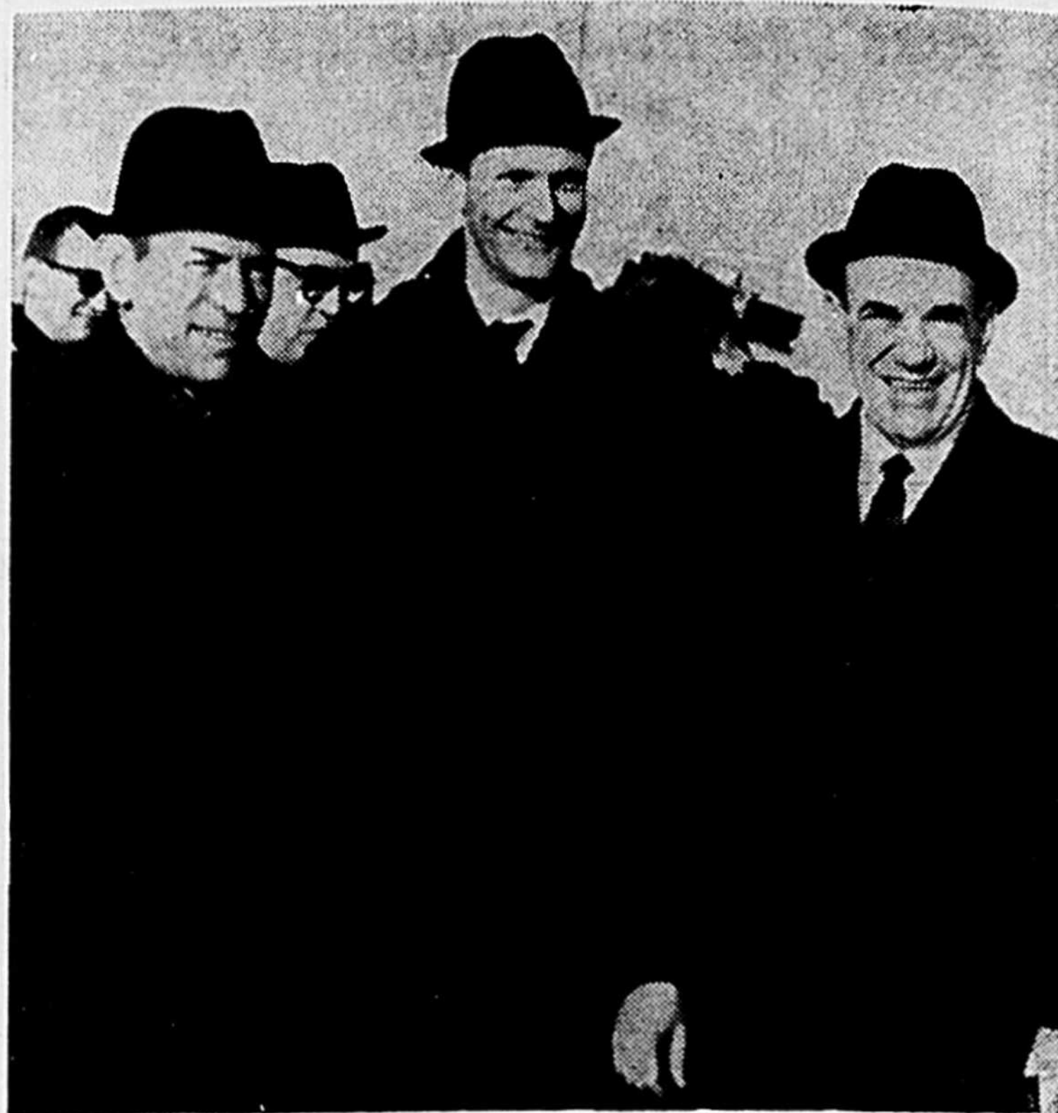
L'honorable Fernand-J. Lafontaine, ministre de la Voirie du Québec, photographié lors de l'inauguration du pont des Trois-Rivières il y a quelques jours, accompagné, à gauche, du maire Maurice Matteau et, à droite, du secrétaire provincial, l'honorable Yves Gabias.