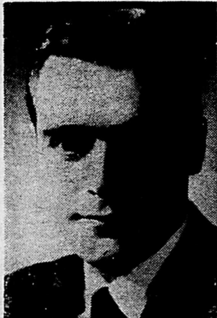
M. Marcel Masse

QUEBEC — Le ministre d'Etat à l'éducation, M. Marcel Masse, quitterait ce ministère d'ici quelques jours pour devenir ministre délégué à la fonction publique en attendant de devenir titulaire du futur ministère du même nom qui doit être créé au cours de la prochaine session.