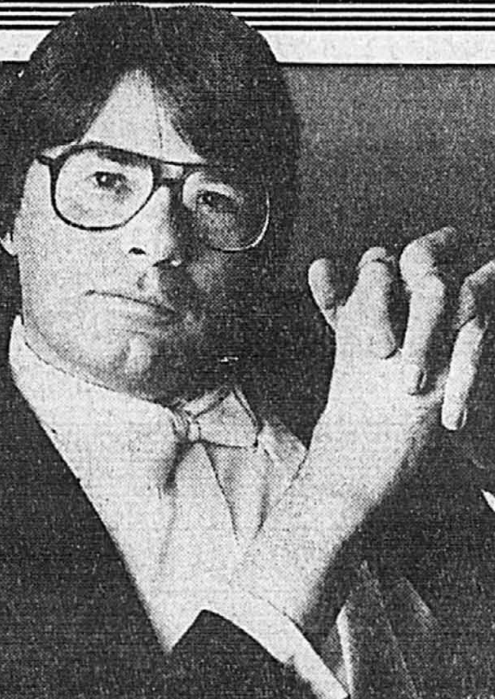
Jeffrey Tate dirigera cinq concerts à l'OSM, dont le premier ce soir.

Le Théâtre d'Art lyrique de Laval présentera Le Médecin malgré lui , opérette de Gounod basée sur la célèbre comédie de Molière, en février. Deux représentations: le 11 à Duvernay et le 13 à Sainte-Rose.