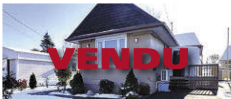
5181 RUE DES MÉLOMANES