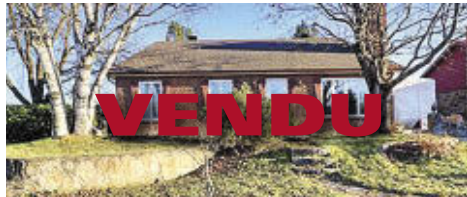
21 RUE DU SEIGLE