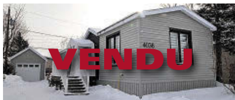
4036 RUE DES TRÈFLES