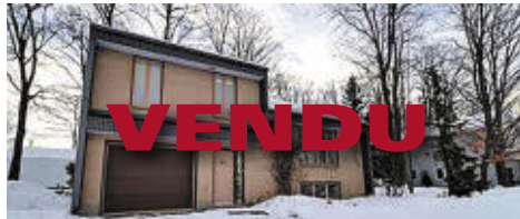
46 RUE DU TAILLEUR