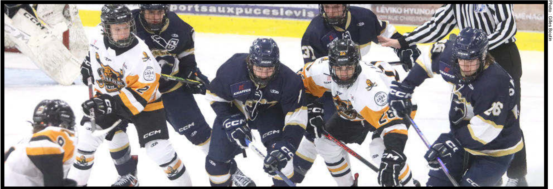
Les Chevaliers de Lévis ont facilement disposé des Albatros, dimanche dernier, dans l'un des derniers duels de la saison régulière.