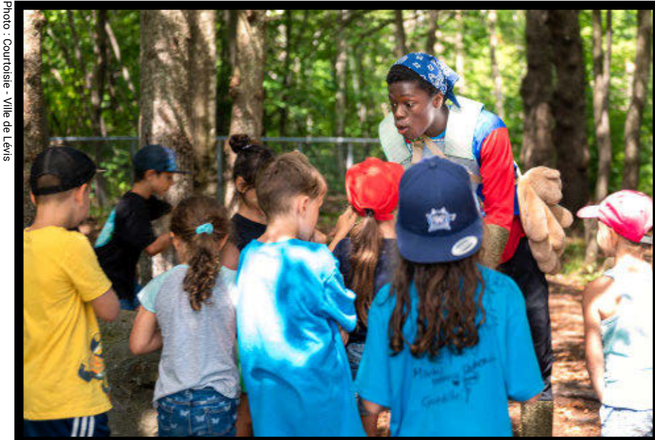
Grands jeux, histoires et thématiques seront au rendez-vous lors de la journée pop-up pour le recrutement de l'équipe des camps de jour de la Ville de Lévis.