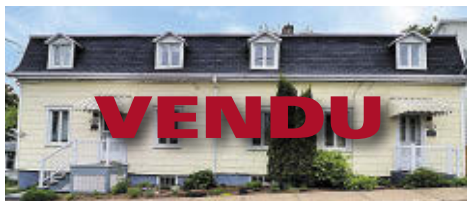
308-310 RUE ST-ONÉSIME