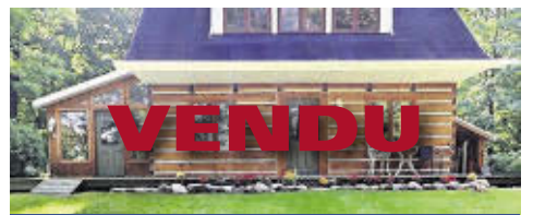
62, ROUTE DE BEAUMONT