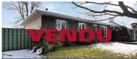
893 RUE PERRIER