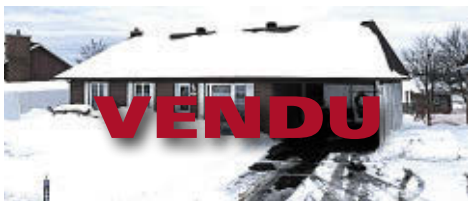
163 RUE DES GASPÉSIENNES