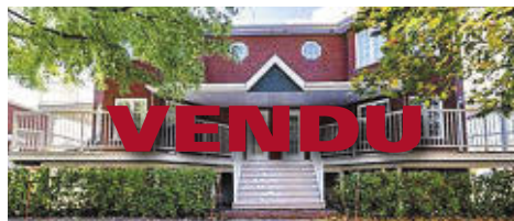
1320 RUE CHARLES-RODRIGUE