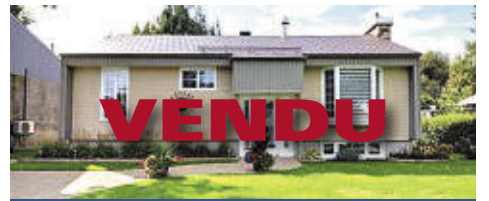
959 DE LA PRAIRIE