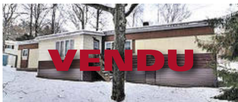
1875 RUE JEAN-ROCH-TARDIF