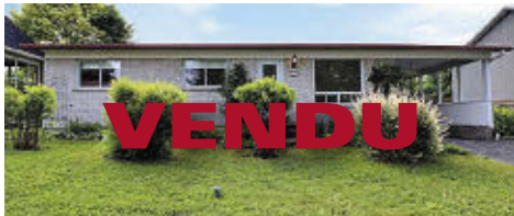
21 RUE DE L'ESPÉRANCE