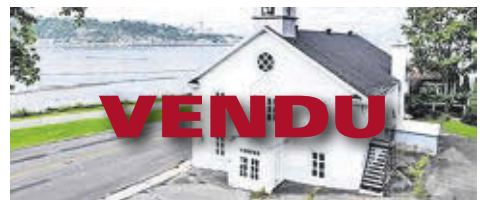
5270, RUE ST-LAURENT

VENDU RÉCEMMENT MERCİ DE VOTRE CONFIANCE