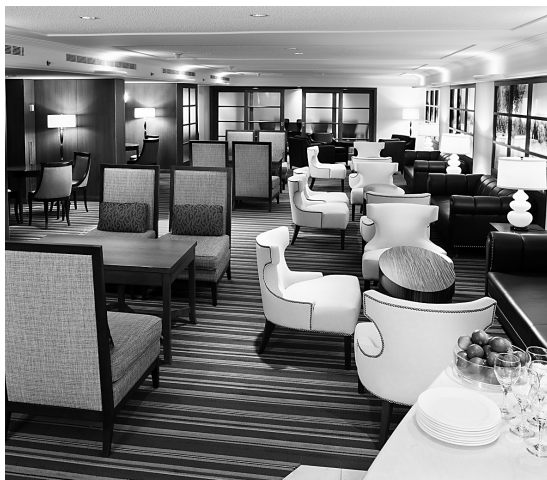
Hôtel Sheraton Laval