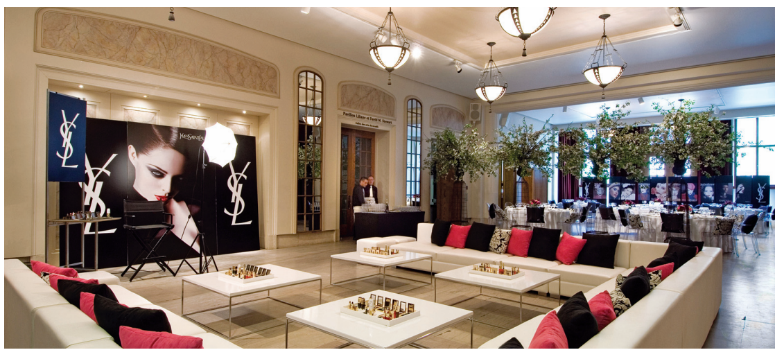
La Salle des miroirs est située dans le pavillon Michal-et-Renata-Hornstein du Musée des beaux-arts de Montréal.

D'un point de vue architectural, on soulignera la variété des possibilités: loin des structures de béton et des petites salles au plafond bas, les salles des musées vont de l'architecture contemporaine nec plus ultra aux décors plus classiques. C'est le cas notamment du complexe muséal du Musée de la civilisation, à Québec, qui dispose de trois sites destinés à l'organisation d'événements aussi bien professionnels que festifs, comme des banquets, des cocktails et des réceptions: le Musée de la civilisation, le Musée de l'Amérique française et le Centre d'interprétation de la place Royale. Inauguré en 1988, le Musée de la civilisation accueille chaque année environ 300 événements, dont une cinquantaine de congrès et de colloques. Parmi ses joyaux, citons son Grand Hall, immense verrière d'une superficie de 930 m 2 , qui allie les vieilles pierres à l'architecture contemporaine en s'ouvrant sur une vue sur la maison Estébe, bâtie en 1751.