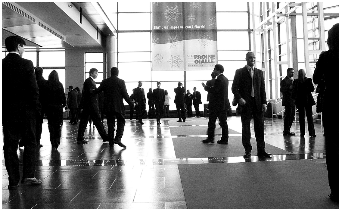
Durant l'année 2009-2010, 146 événements ont eu lieu au Centre des congrès de Québec, dont 52 congrès.