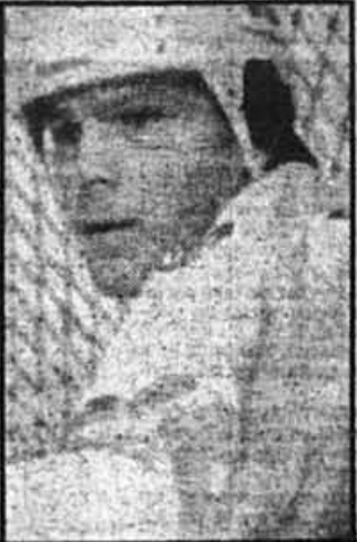
Peter Stastny, des Nordiques, a marqué 18 buts en 52 tirs, environ un but à chaque trois lancers.