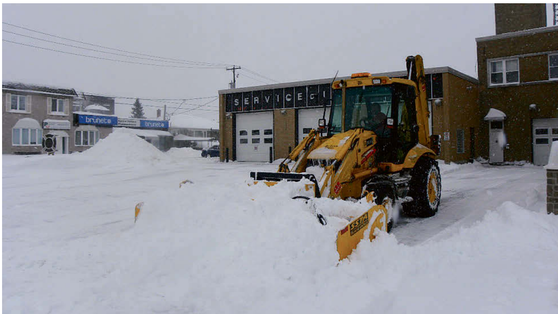
Les déneigeurs doivent augmenter leurs tarifs de façon considérable cette année.