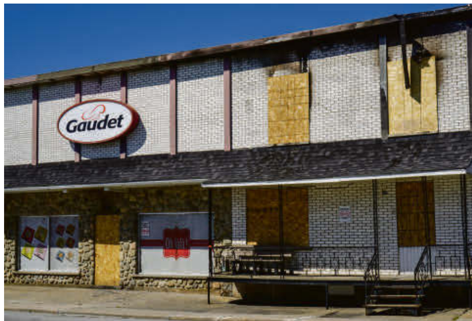
L'appel d'offres entourant l'acquisition de la Pâtisserie Gaudet s'est terminé le 22 septembre.

Tous les intéressés ont eu la chance de visiter les locaux et de consulter les états