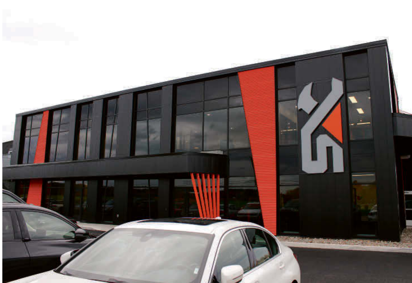
L'usine située à l'intersection de la route 139 et de la rue Fil-de-l'eau a officiellement démarré ses opérations en juin.

Passant de débroussailleuses pour excavatrice à grappin fendeur, une douzaine de produits sont présentement fabriqués à l'usine chaque semaine. L'objectif des pro-