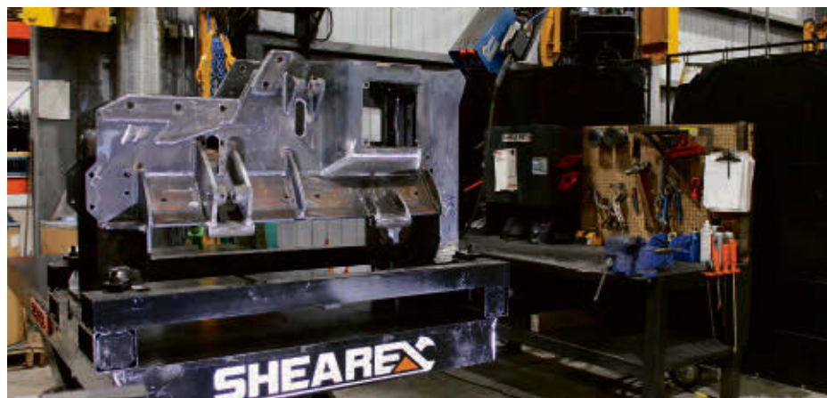
L'équipe de production s'affaire à la conception, à la soudure, à la peinture et à l'assemblage des différents modèles de débroussailleuses signées Shearex.

En attendant ce déploiement, l'entreprise continue de livrer la marchandise écoulée vers les États-Unis où 85 % de la production est vendue à travers ce pays.