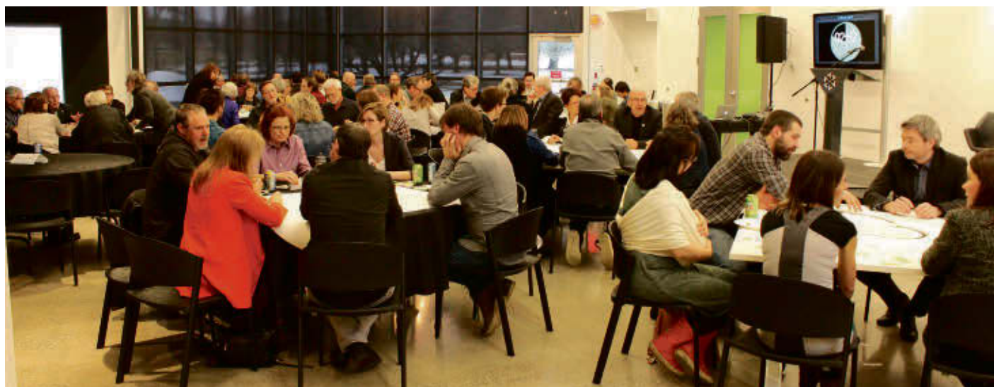
Le Grand rendez-vous annuel, organisé par l'organisme Valcourt 2030, lors d'une précédente édition.

Il s'agira d'une soirée participative où les citoyens pourront partager leurs perceptions de la participation citoyenne et leurs priorités de développement à travers une suite d'ateliers ludiques et participatifs. Rappelons que la mission de l'organisme est de regrouper les personnes intéressées au développement communautaire, culturel, économique et social de la Ville de Valcourt et du Canton de Valcourt afin de créer un milieu d'innovation dans tous les secteurs de la région.