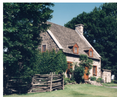
Le patrimoine, une richesse inestimable !

Les dernières semaines ont été fort occupées avec la réfection de plusieurs rues importantes, dont Curzon, Green et Merton. Grâce aux conditions climatiques exceptionnelles que nous avons connues, tous ces travaux se sont déroulés selon l'échéancier prévu. La réfection de la rue Saint-Georges est maintenant entamée, ce qui occasionnera malheureusement des problèmes de circulation, de bruit et de poussière pour les prochaines semaines. Je tiens à remercier l'ensemble des citoyens touchés par ces travaux pour leur patience et leur tolérance et les invite à continuer de respecter la signalisation.