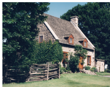
Our heritage: invaluable wealth!