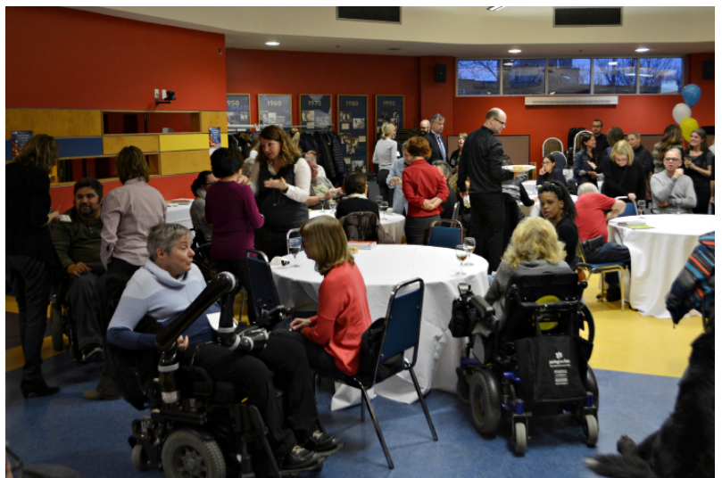
Lancement du guide à l'IRGLM, le 23 novembre.