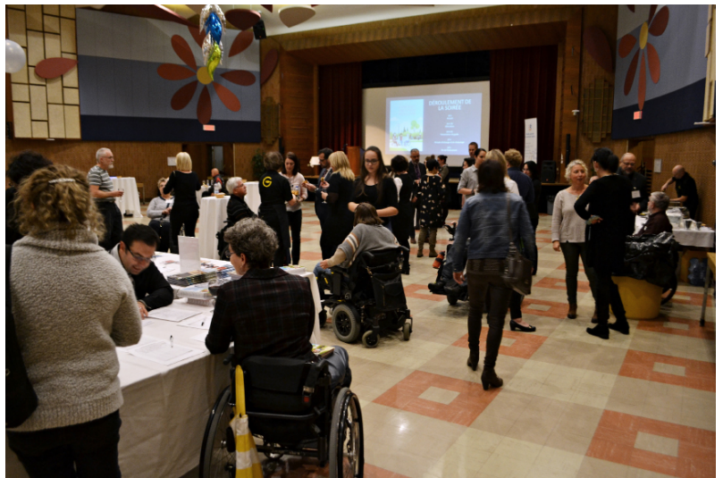
Lancement du guide à l'IRDPQ, le 15 novembre.

MÉMO-Qc remercie chaleureusement tous ceux et celles qui ont contribué d'une manière ou d'une autre à faire de ces lancements, ainsi que de ce nouveau guide, une réussite.