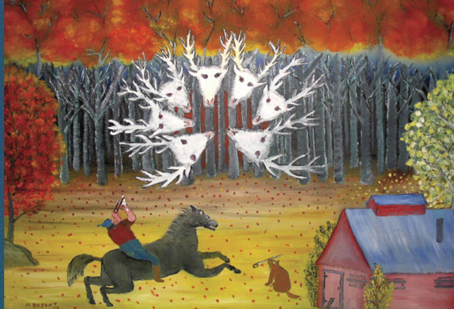
Jean-Claude Dupont, La bête à sept têtes / Collection Jean-Claude Dupont / Photo : Éditions GID

figurant dans les légendes ont attiré notre attention, par exemple les faits historiques et les faits divers évoqués dans ces histoires. Autant d'éléments, d'événements, de repères qui cristallisent les préoccupations de toute une communauté et ce qui l'a profondément marquée, bref un inconscient collectif qu'il nous est possible de mieux comprendre.