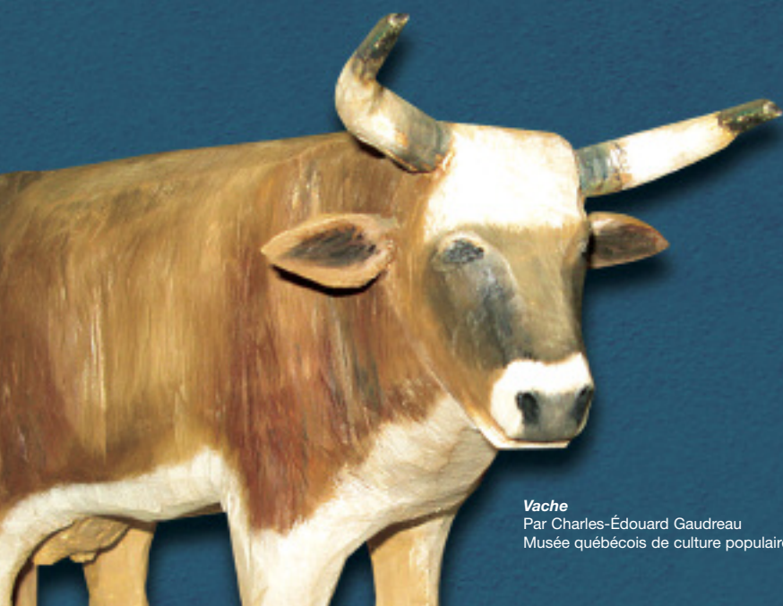
Vache Par Charles-Édouard Gaudreau Musée québécois de culture populaire

Cette exposition, riche et colorée, donne une attention particulière aux divers personnages qui teintent chacune des légendes. Des thèmes récurrents nous sont apparus incontournables. Par exemple, il suffit de penser à la notion du bien et du mal qui est omniprésente dans les légendes, ou encore à l'environnement, qui est plus qu'un milieu de vie pour nos ancêtres, à la fois source de mystère ou d'explication des choses. D'autres repères