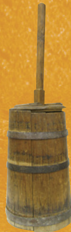
Baratte à beurre Musée québécois de culture populaire

Pointe-à-Callière et HISTORIA vous invitent Sur le chemin de l'Acadie . Courez la chance de gagner un voyage pour deux dans les Maritimes!