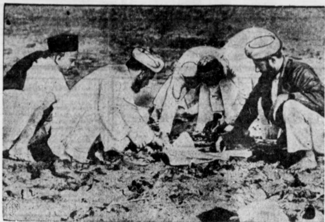
Quelques suivants de Mahatma Gandhi ramassent le minéral précieux sur le rivage à Dandi. Ils sont passibles par cet acte d'une poursuite de la part des autorités anglaises qui se voient obligées maintenant de recourir à la rigueur pour remettre le pays en ordre.