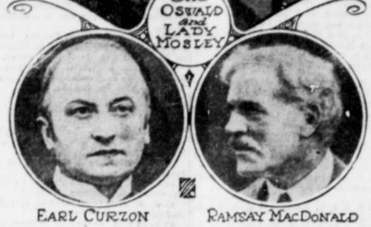
EARL CURZON RAMSAY MACDONALD

La démission de Sir Oswald Mosley du cabinet travailliste a lancé le premier ministre Ramsay MacDonald, (en bas à droite) dans une position assez périlleuse et lui a fait craindre la perte du pouvoir. Sir Oswald a démissionné parce que le parti de MacDonald n'a pas pu ou voulu admettre une de ses conceptions sur le bill du chômage. Dans la partie supérieure de la vignette on voit Sir Oswald et son épouse, fille du grand homme d'état anglais le comte Curzon, (en bas à gauche).