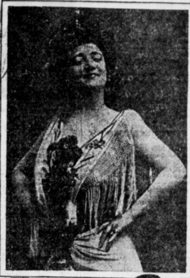
EMMA CALVÉ dans "Carmen".

A chaque jour suffit sa peine, dit-on à Hollywood.— Les succès de la Warner Brothers.— Les opinions des grands réalisateurs des Etats-Unis.— Le grain de sel de l'Europe. LES GRANDES PRIMA-DONNA