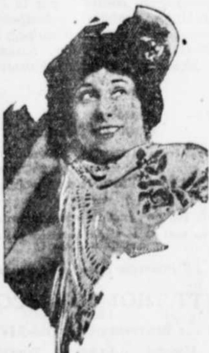
GERALDINE FARRAR de nos cinémas.