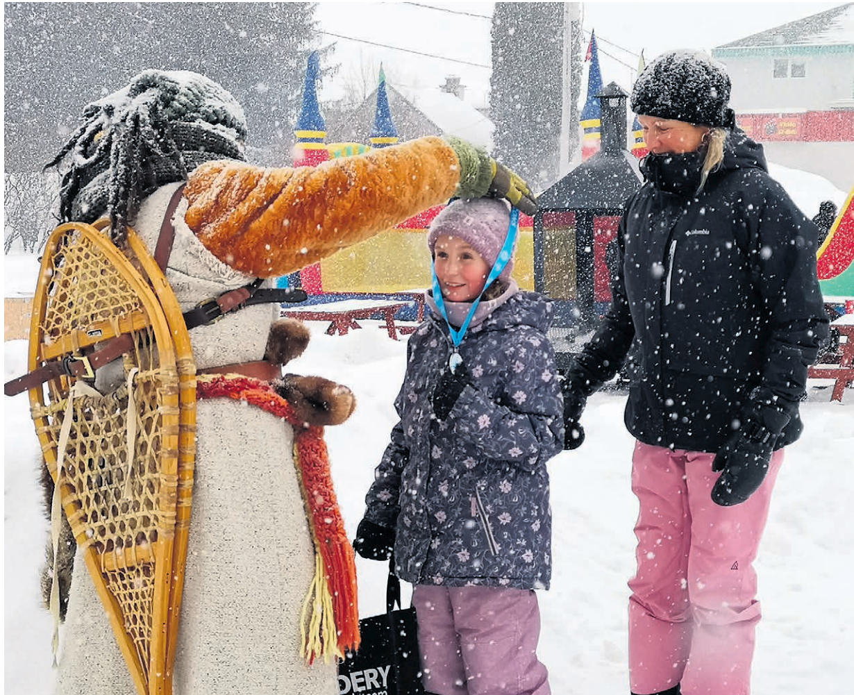
Plusieurs activités ludiques et sportives seront organisées lors des Floconnades.