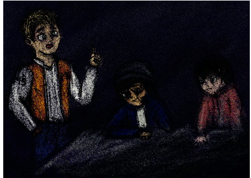
Dessin : Bernardo Cruz

- Personne n'est sûr de rien. Nous nous sommes tous réveillés ici il y a quelques minutes, sans vraiment savoir pourquoi ni comment cela s'est produit.