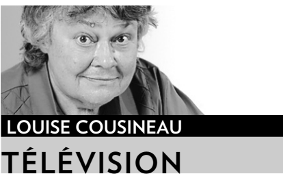
LOUISE COUSINEAU TÉLÉVISION

Quand je pense au pauvre avocat de Radio-Canada qui s'est longuement penché sur le cas des trois plaignards d' Occupation double . S'il s'est ennuyé autant que moi, je le plains. Cette hésitation de Radio-Canada donnait à penser qu'on allait tomber sur des révélations-chocs des recalés de la télé-réalité.