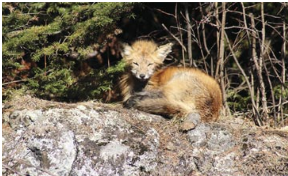
Un premier hiver pour ce renardeau.

Les sizerins, petits oiseaux qui nichent dans le Grand Nord, sont arrivés à Saint-Hippolyte pour l'hiver. Rarement seuls, ils étaient perchés sur des tiges de rudbeckies en train de se nourrir des graines qui pointaient au-dessus de la neige. Ils visiteront à coup sûr les mangeoires que je remplis de tournesol dès qu'elles se vident.