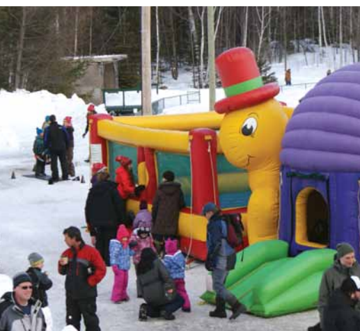
Festival d'hiver : Jeux gonflables

Veillez adresser votre dossier avant le 25 janvier 2013 à l'adresse suivante : Municipalité de Saint-Hippolyte à l'attention de Madame Anne-Marie Braün au 2253, ch. des Hauteurs, Saint-Hippolyte, Québec J8A 1A1