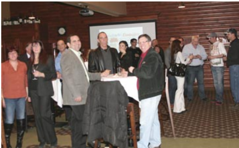
Une trentaine de gens d'affaires s'étaient réunis pour le cocktail.