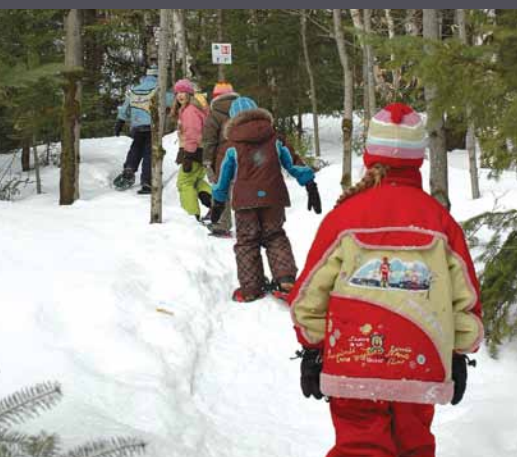
Festival d'hiver : Randonnée en raquettes