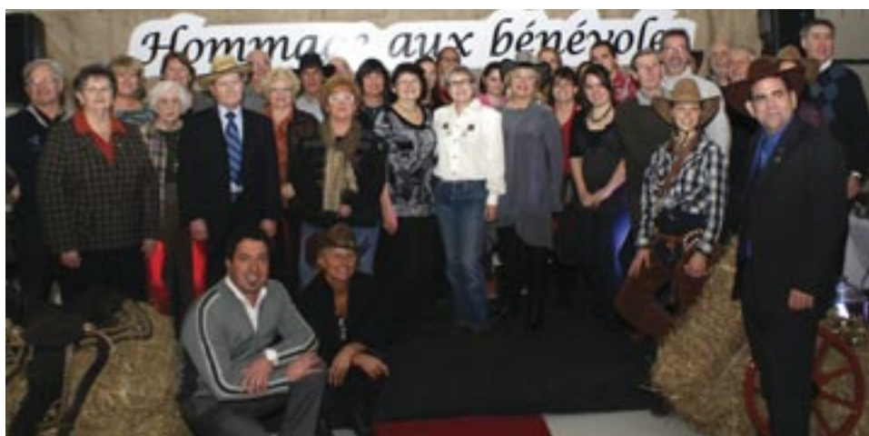
Une trentaine de bénévoles se sont particulièrement illustrés par leur dévouement tout au long de l'année 2012.

Le 25 novembre, la municipalité de Saint-Hippolyte s'est fait un point d'honneur d'organiser la 13 e édition du Brunch des bénévoles. Plus de 203 bénévoles de 36 associations ont été conviés à cet événement symbolique et rassembleur.