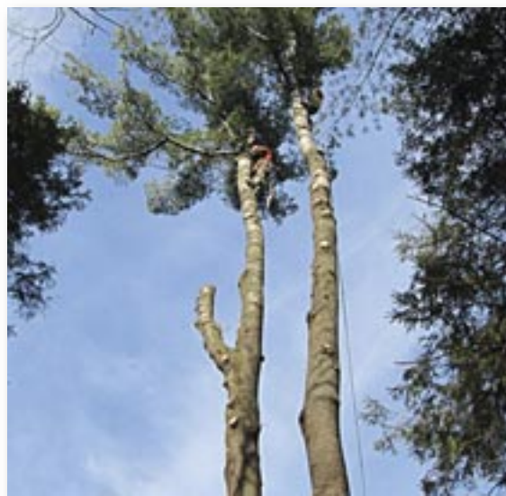
Pin blanc.

Il y a quelques semaines, on a abattu un grand pin blanc pour cause de dangerosité. Sa chute aurait probablement écrasé des maisons ainsi et aussi arraché plusieurs dizaines d'arbres.