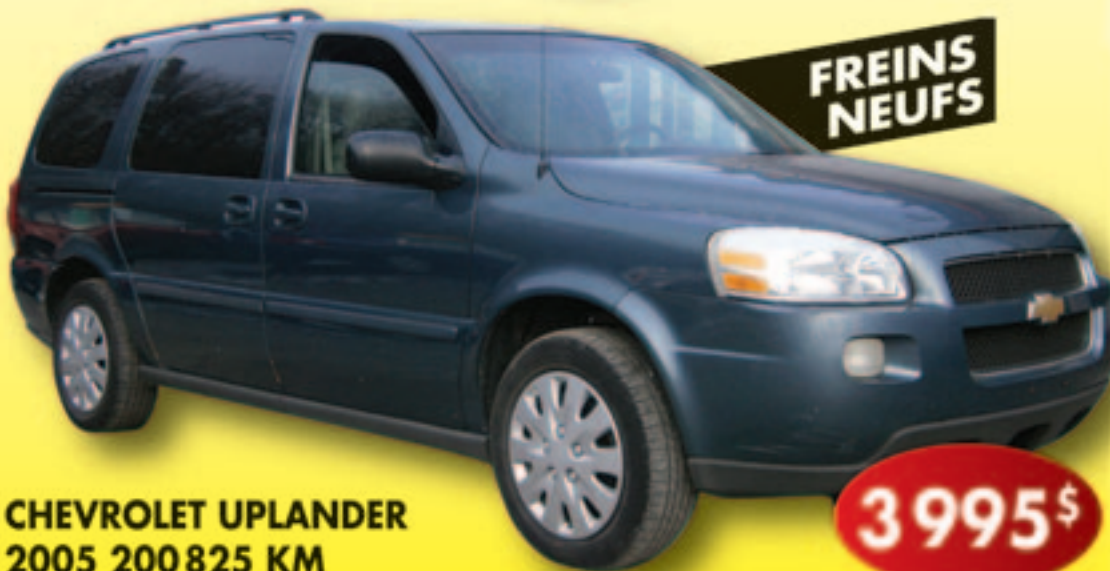
CHEVROLET UPLANDER 2005 200 825 KM