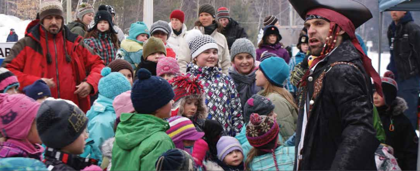
Festival d'hiver de Saint-Hippolyte 2012 : La chasse au trésor