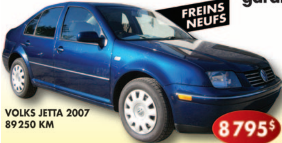
VOLKS JETTA 2007 89 250 KM